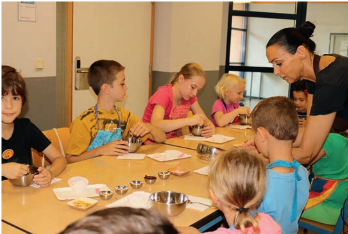
Rühren, rühren, rühren - kein einziges Kakaohümpchen darf bleiben, damit die Schokolade zart und cremig wird