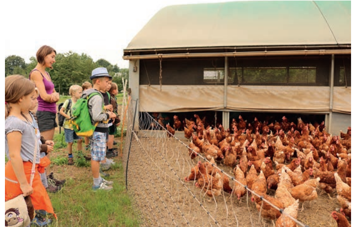
Interessante Beobachtungen machten die Ferienspäßkinder auf dem Hühnerhof von Gut Werbronn

Geschehen. Der Hof liegt am Berg bei der Bundesstraße zwischen Weingarten und Grötzingen und verfügt über drei Stallungen. Zuerst ging es zum hoch gelegenen Stall mit eingezäuntem Auslauf. „1200 Hühner wohnen hier drin“, erklärte die Bäuerin. Dann öffnete sie eine Klappe und gackernd und flatternd drängelte das braune Federvieh ins Freie. „Warum machen wir das? Warum halten wir Hühner?“ wollte sie von den Kindern wissen und schnell war klar, dass das hier kein Hähnchenmastbetrieb, sondern eine Eierproduktionsstätte sei. Plötzlich ein lautes Flügelschlagen und wie auf Kommando setzt sich ein Großteil der Hühnerschar wieder in Bewegung zurück in den Stall. „Flüchten die vor uns?“ fragten einige Kinder. Aber nein. Drinnen im Stall fand die Fütterung statt.