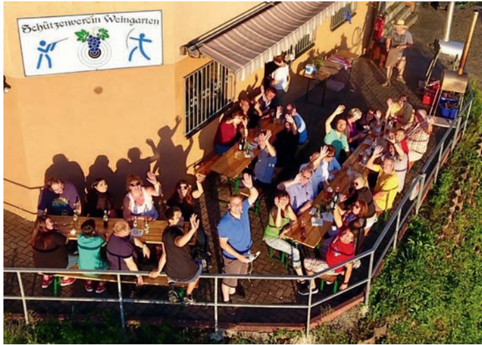
Gut besuchtes Monatstreffen.

Vielen Dank Manfred und Winne, es hat super geschmeckt