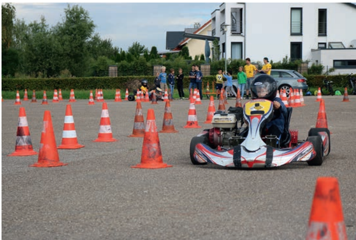
Eine Handbreit über dem Asphalt sind die Karts zwischen den Pylonen unterwegs