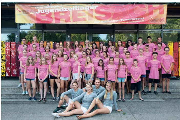
Das Breisach-Teilnehmer-Team 2017 vom Karlsruher Turngau