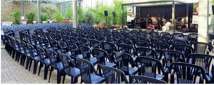
Wir brauchen noch mehr Stühle im Gewächshaus Stärk!