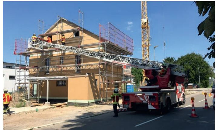
Patiententransport über Drehleiter

Weingarten (old). Am Montagmittag um 12:44 Uhr wurde die Feuerwehr Weingarten sowie die Drehleiter der Feuerwehr Stutensee zu einer Personenrettung in die Bruchsaler Straße in Weingarten alarmiert. Dort hatte der Rettungsdienst der mit einem Rettungswagen, einem Notarzt und der Notfallhilfe vor Ort war um die Hilfe der Feuerwehr gebeten, um einen Patienten mit einer internistischen Erkrankung schonend über die Drehleiter von einer Baustelle zu fahren. Für die Rettungsmaßnahmen kam die Drehleiter der Feuerwehr Stutensee sowie eine Schleifkorbtrage zum Einsatz. Die Kräfte der Feuerwehr Weingarten unterstützten die Maßnahmen bei der Patientenübergabe. Die Feuerwehr Weingarten war unter der Leitung des Kommandanten Günther Sebold mit einem Hilfeleistungslöschfahrzeug und einer Drehleiter im Einsatz.