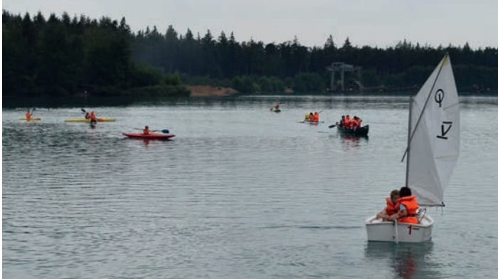
Behinderten- und Rehabilitationssportverein Weingarten e. V.