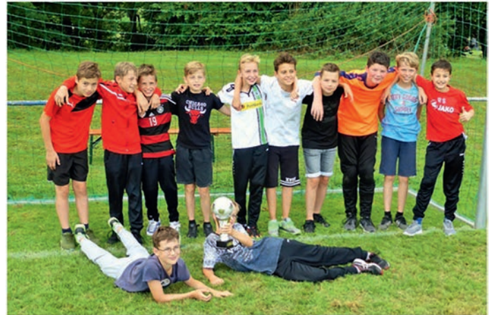
Die D-Jugend formiert sich neu

Kampfgeist sowie Siegeswillen. In den nächsten Wochen heißt es nun für das neu zusammengestellte Trainerteam eine schlagkräftige Mannschaft für die kommende Staffellrunde zu formen.