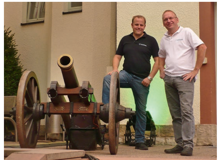
Traditionell verkündet der Schützenverein mit Salutschüssen die Eröffnung des Wein- und Straßenfestes.