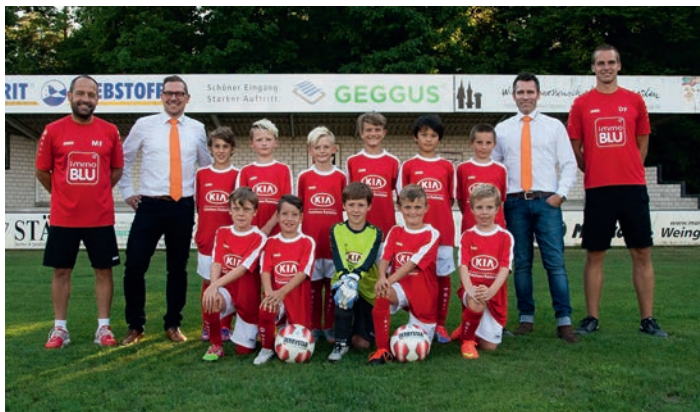
Die erfolgreiche F1 in ihren neuen Trikots

Die anstehende Sommerpause habt Ihr Euch redlich verdient!