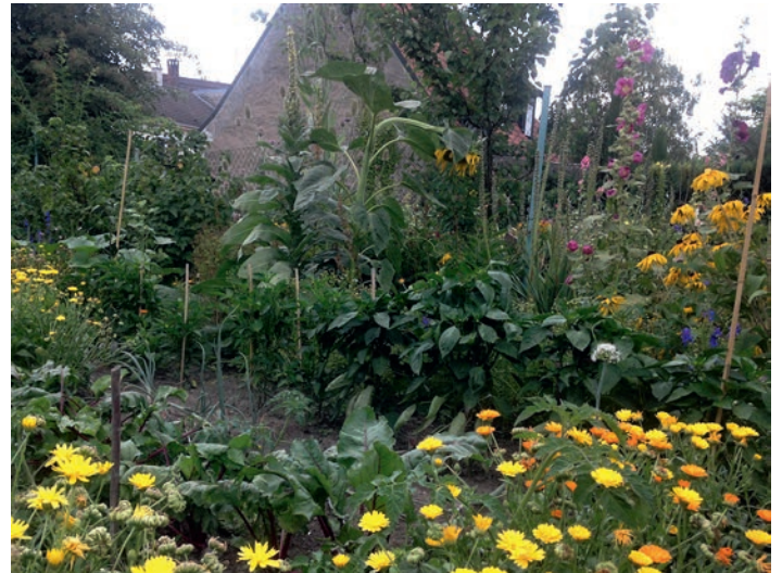
In den Gärten steht nun alles in schönster Blüte.

Wir probieren jetzt aus, wie die Tour des Jardins klappt und wollen sie nächstes Jahr dann früher bzw. mehrere Male durchführen, um noch mehr Vielfalt im Garten zu sehen.