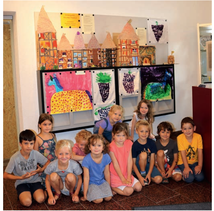
Bürgermeister Bänziger empfing die Kinder des Kindergartens „Am alten Friedhof“, die Bilder aus Weingarten im Rathaus ausstellen durften.

an der Pinnwand im Bürgerbüro. Der Bürgermeister rundete das Thema „Weingarten“ noch mit einem kurzen Rundgang durchs Rathaus ab. Er zeigte ihnen, dass in den Räumen des Bürgerbüros ebenfalls Weingartener Motive an die Wand gemalt waren, ganz ähnliche, wie von den Kindern entdeckt.