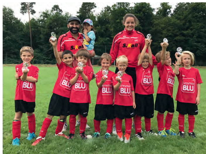
Die F3-Jugend startet durch

Nächste Wochenende haben wir gleich zwei Turniere bevor es in die Sommerpause geht. Am Samstag spielen wir beim VfB Grötzingen und am Sonntag sind wir bei Germania Friedrichstal.