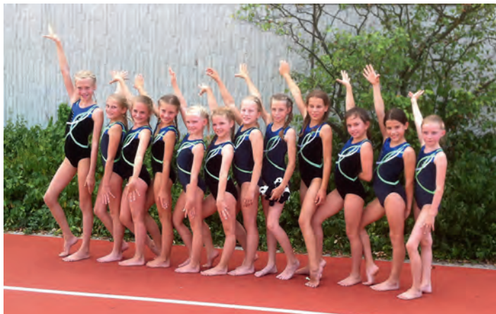
4. + 6. Platz in der Gauliga 2017 erreichten die „Turnküken“