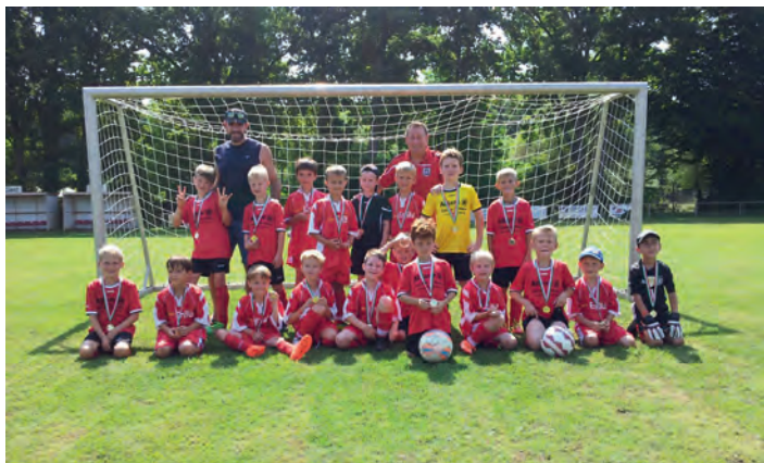
Die erfolgreiche F2-Jugend

Diese Leistung wurde dann aber am Sonntag beim Turnier in Langensteinbach noch getoppt. Der Ball lief in unseren Reihen und sogar neutrale Zuschauer applaudierten für diese tollen Leistungen. Bei einem Tor haben alle unsere fünf Feldspieler den Ball direkt gespielt und ein Tor erzielt. Schulbuchmäßig und für uns Trainer sensationell!