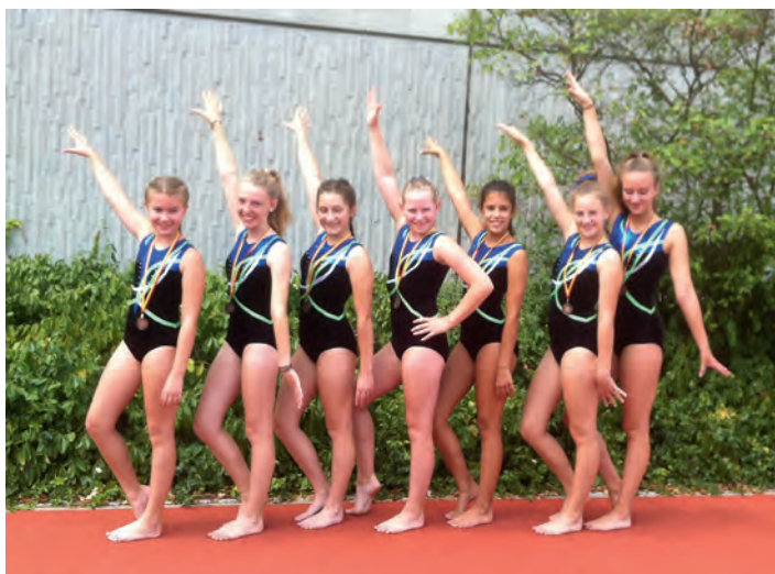
Die „Großen“ erkämpften sich den 3. Platz in der Gauliga 2017

Herzlichen Glückwunsch unseren Mädels und „Danke“ an den Fanclub, der sich in der Hitzeschlacht prima gehalten hat.