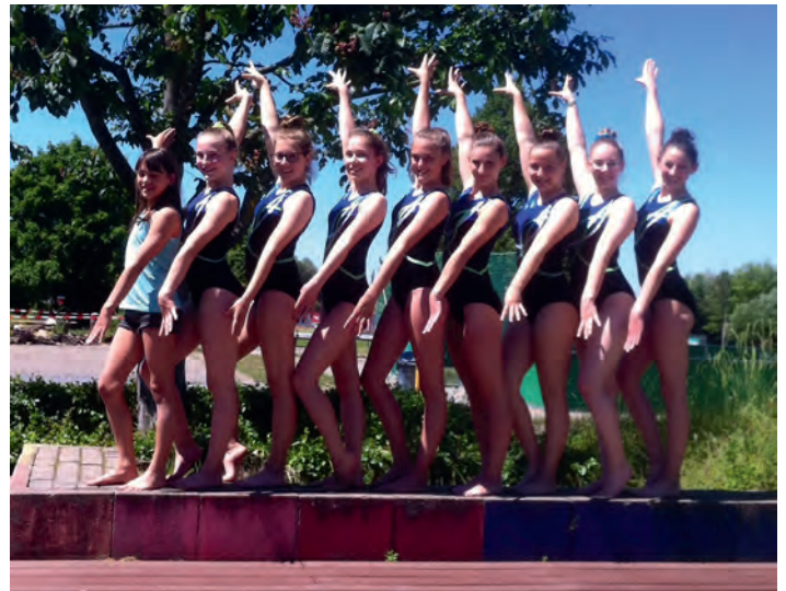
TSV Weingarten mit der drittbesten Mannschaft in der Regioklasse 2017