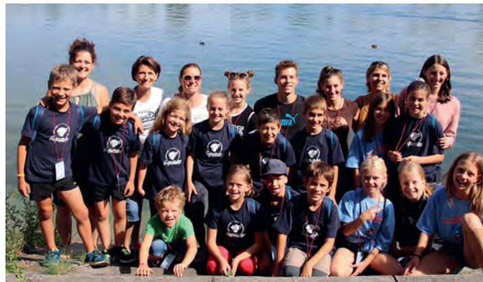
Super SGW-Mannschaft: 2. Platz beim Landeskinderturnfest in Konstanz