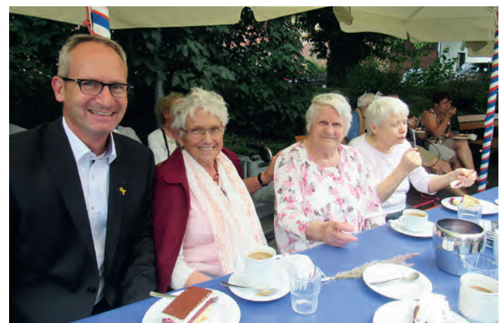
Bürgermeister Bänziger besuchte die Senioren beim Sommerfest im Haus Edelberg

Vergangenen Sonntag fand im Haus Edelberg Senioren-Zentrum Weingarten das traditionelle Sommerfest statt. Nachdem das Motto im vergangenen Jahr „Sommer auf dem Land“ gewesen war, wandte man sich dieses Mal den Nachbarn zu: „Frankreich“ war das Leitthema.