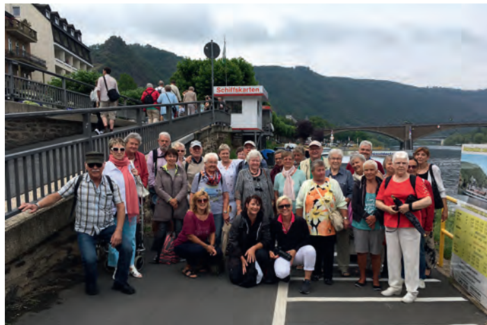
Rehagruppe Ausflug Mosel 2017

Am Dienstag, den 27.06.2017 fand unser jährlicher Vereinsausflug statt. Dieses Jahr ging es für die Teilnehmer der Rehasport-Gruppen aus Weingarten nach Cochem an die Mosel. Von dort aus sind wir mit dem Schiff nach Beilstein gefahren. Die ca. 1Std Fahrt auf dem Schiff war sehr interessant. Wir fuhren durch eine wundervolle Landschaft, sowie die Geschichte mit ihren Burgen und Ortschaften war sehr informativ. In Beilstein angekommen, konnten alle den Ort in „Eigenregie“ erkunden. Ob man den Aufstieg auf die Burg wagen wollte, blieb jedem selbst überlassen. Nach ca. 3Std fuhren wir wieder zurück nach Cochem und von dort aus wieder mit dem Bus nach Weingarten. Leider hatte es das Wetter dieses Jahr nicht so gut mit uns gemeint, trotz allem waren alle entspannt und glücklich. Um 19.00 Uhr waren dann alle wieder gesund und munter in Weingarten angekommen.