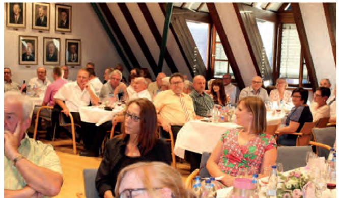
Genau 56 Wahlmänner und Wahlfrauen verfolgten im Turmzimmer des Rathauses die Vorstellung der Bewerberinnen und hatten anschließend die Qual der Wahl.

Danach hatte das Publikum die Qual der Wahl. Zehn, acht, sechs