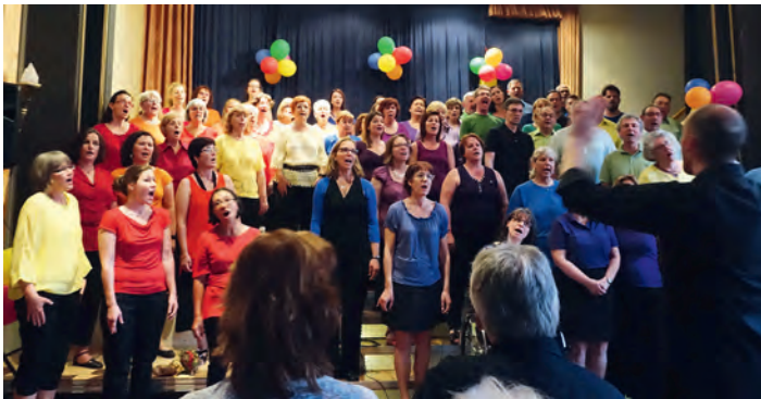
Beide Chöre auf der Bühne

Ein Teil des Chores war an diesem Vormittag damit beschäftigt, die Bühne für unser abendliches Konzert aufzubauen. Bei tropischen Temperaturen trafen wir uns alle nachmittags im Ziegleraal in Karlsruhe zum Stühle stellen und anschließender Generalprobe. Bei Kuchen und Brezeln konnten sich die Spanier ausruhen, während die Swinging Voices probten. Auf der Bühne lag die gefühlte Temperatur noch zehn Grad höher. Trotzdem klappte die Generalprobe gut. Ruck zuck war es Abend und die ersten Konzertbesucher trafen ein.