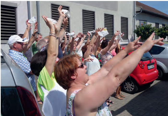
Taschentücher zum Abschied