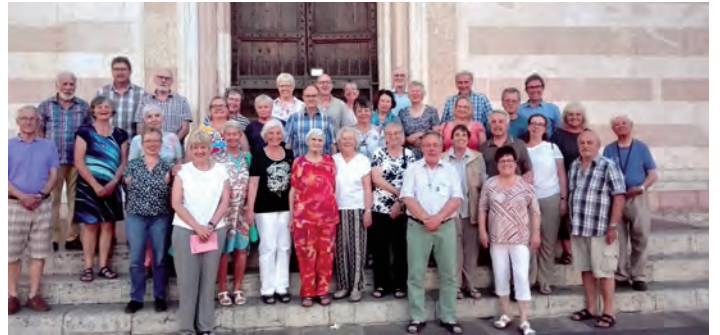
Pilgergruppe der Kirchengemeinde Stutensee-Weingarten

der Natur. Auf der Rückfahrt im Bus waren wir uns einig: jeder von uns hatte ein kostbares Andenken im Gepäck, das man in keinem Souvenirshop der Welt erwerben kann.