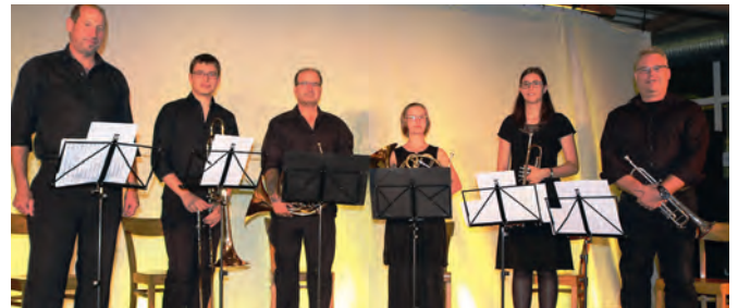
Das Bläserensemble des Musikvereins bereicherte den Abend mit seinen hervorragend gespielten kurzen, aber anspruchsvollen Musikbeiträgen