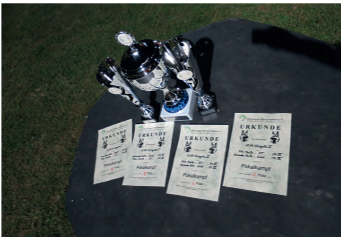
Wanderpokal mit Pokale für ersten und zweiten Platz

Am 24. Juni 2017 fand im Rahmen des Sommerfestes der SV OG Obergrombach ein Pokalkampf statt.