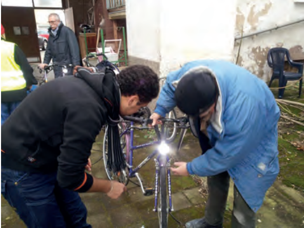
Verkehrssicherheit wird groß geschrieben

Hinter dem unscheinbaren Hoftor des Anwesens Bahnhofstr. 54 verbirgt sich das Fahrradparadies des Freundeskreises. Hunderte von „Drahteseln“ wurden bereits von freundlichen Mitbürgern gestiftet, vom Kinderfahrrad bis zum Mountain-Bike. Sie bevölkern Schuppen und Scheune und warten darauf, von erfahrenen Händen wieder fahrbereit und verkehrssicher gemacht zu werden.