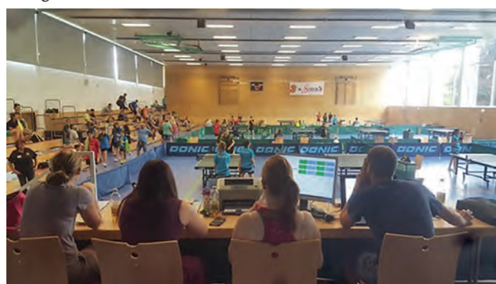
Die Turnierleitung hatte alles im Griff