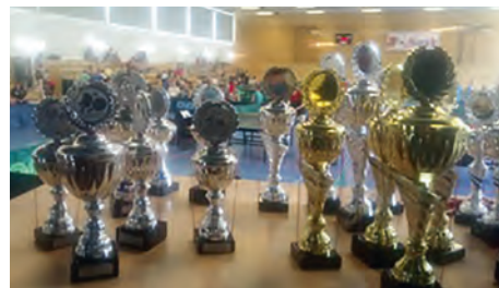
Die ersehnten Trophäen