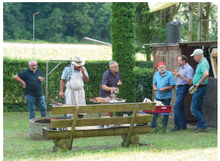
Männerchor-Treffen des GV Frohsinn