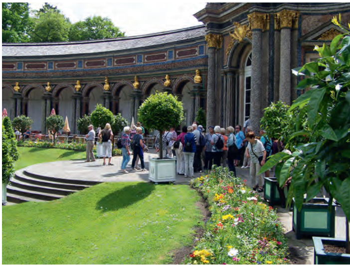
In der Eremitage in Bayreuth