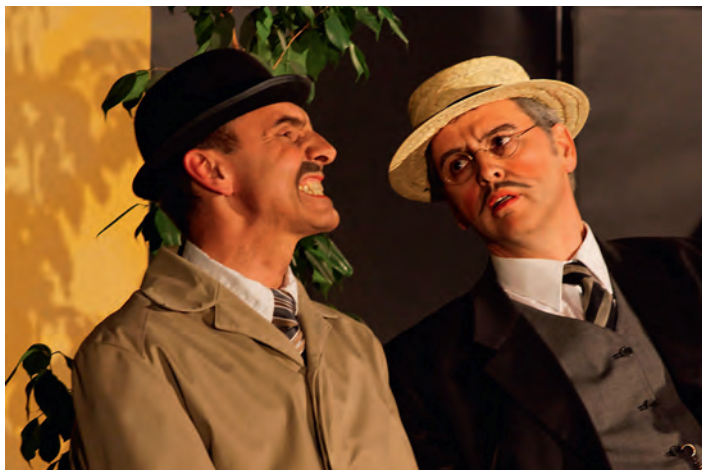
„Häberle und Pfleiderer“ sind auch 2017 mit dabei.

Moderator Markus Kleefeld wird Ihnen das Programm näherbringen und unser musikalischer Partner ist in diesem Jahr der Musikverein Weingarten. Beginn ist um 19.30 Uhr, Einlass ab 18.45 Uhr. Vor Beginn und in der Pause bewirten wir Sie mit Häppchen und kühlen Getränken. Karten bekommen Sie an der Abendkasse oder im Vorverkauf bei der Buchhandlung „Bücherwurm“. Der Eintritt kostet 10 Euro, ein Glas Sekt ist im Preis enthalten.