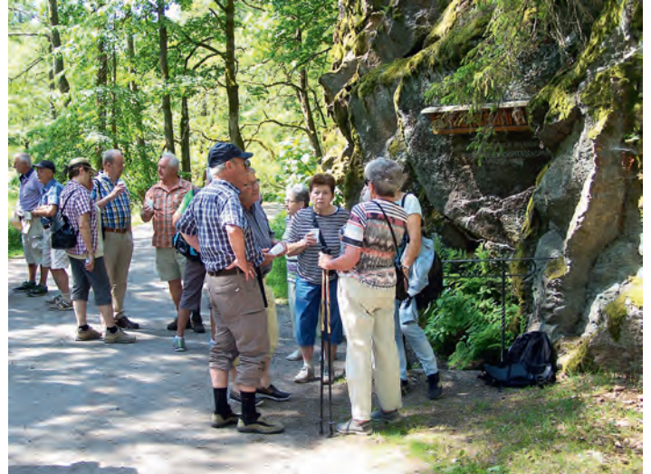
Pause beim Wandern im Waldnaabtal