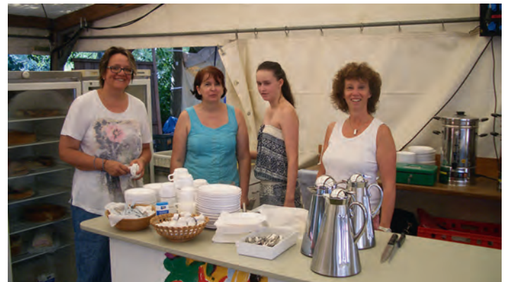
Die Damen vom Kuchenbuffet warten gespannt auf die leckeren Gebäckspenden

Die Vorstandschaft bedankt sich schon jetzt für die vielen helfenden Hände aus allen Abteilungen des Vereins!