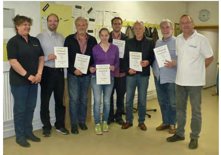
Vereinsmeister der Bogenschützen