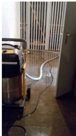
Wasserausumpfen der Kellerräume

Weingarten (old). Am Samstagmorgen, 07.01.2017, um 10:27 wurde die Feuerwehr Weingarten zu einem Wasserschaden in die Neue Bahnhofstraße gerufen. Aufgrund eines Wasserrohrbruchs im Baustellenbereich der Neuen Bahnhofstraße ist Wasser in die Keller zweier dortiger Häuser gelaufen. Die Feuerwehr verständigte daraufhin den Bauhof Weingarten und somit den zuständigen Wassermeister, der sich dem Rohrbruch annahm. Die Feuerwehr pumpte mit Hilfe zweier Wassersauger die betroffenen Kellerräume aus. Da durch den Bruch der Leitung immer wieder neues Wasser langsam nachlief, wurde ein Wassersauger an der Einsatzstelle belassen, damit der Bauhof zusätzlich zur Beseitigung des Schadens die restlichen Wassermengen aufnehmen konnte. Die Feuerwehr Weingarten war unter der Leitung des stellvertretenden Kommandanten Christian Koch rund zwei Stunden im Einsatz.