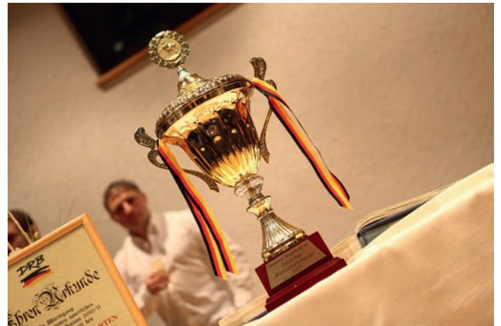
Germanen greifen wieder nach dem begehrten Pott

Nach der Rückkehr aus Pforzheim findet in der heimischen Mineralix-Arena am Samstagabend die traditionelle große Abschlussfeier statt. Neben Speisen und Getränken wird die Veranstaltung von Live-Musik umrahmt und auch die SVG-Bar öffnet bis in die Nacht zum letzten mal in dieser Saison ihre Pforten. Wir freuen uns auf Ihren Besuch!