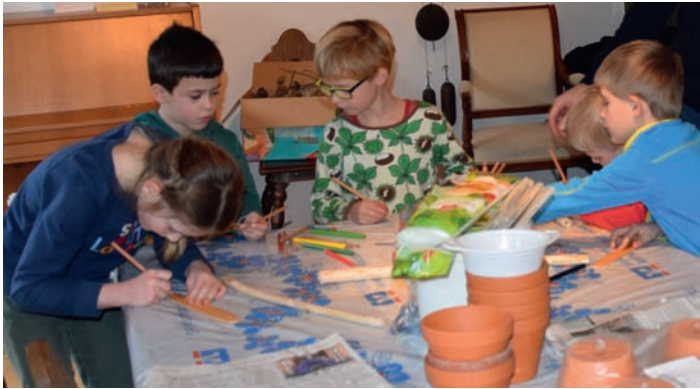
AGNUS-Jugend Kinderwinterwerkstatt Gruppe 2

ar 2017 um 20:00 Uhr im Goldenen Löwen. Vorschläge zur Tagesordnung können bis Samstag, 28.01. bei Patricia Baumgarten <patricia@agnus-weingarten.de> eingereicht werden.