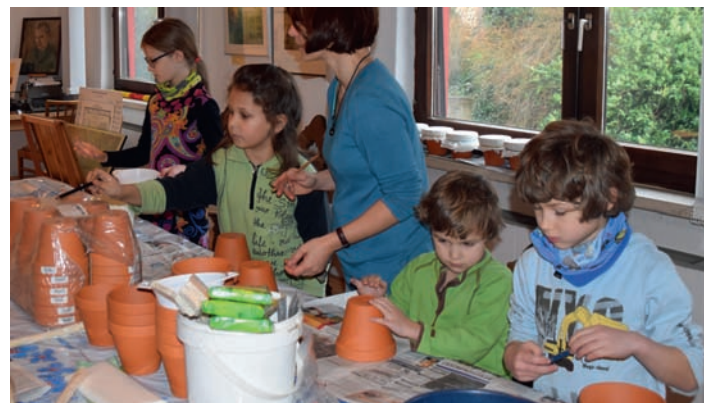
AGNUS-Jugend Kinderwinterwerkstatt Gruppe 1

Nachdem unsere gute Kooperation mit dem Bürger- und Heimatverein so gelobt und mit dem 1. Preis Kreisumweltschutzpreis gewürdigt wurde, geht es damit weiter: Die Kinder-Winter-Werkstatt findet wieder für die angemeldeten Kinder in zwei Gruppen, je 1,5 Stunden statt. Das diesjährige Thema ist Upcycling , also Aufwertung und wir haben um einiges Material gebeten, dass wir im Sinne der Aufwertung verarbeiten möchten. Der erste Termin ist Samstag, 21.01.2017 entsprechend der Gruppe von 9:30 bis 11:00 bzw. von 11:15 bis 12:45 Uhr. Wir freuen uns auf euch! Eure AGNUS-Jugend-Leiter/innen Liebe Mitglieder, bitte beachtet unsere Jahreshauptversammlung ist am Montag, den 30. Janu-