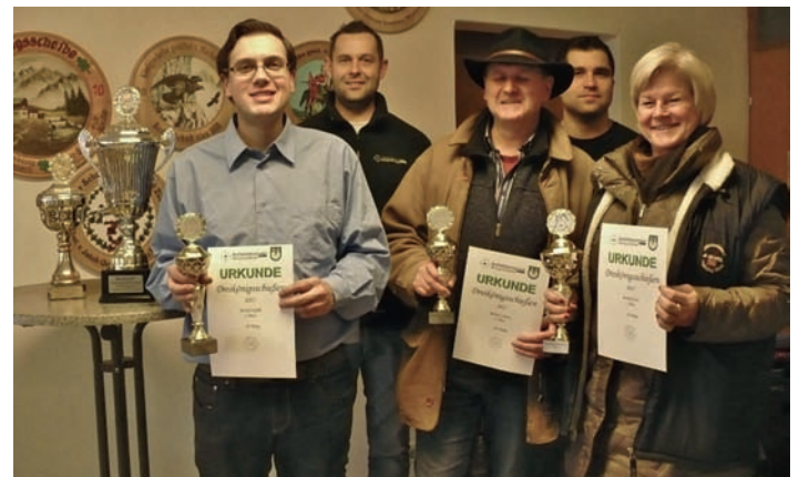
Die Sieger des Generationenschießens

Mit dem Generationenschießen am Dreikönigstag startete der Schützenverein Weingarten traditionell ins neue Jahr. Ziel war es dabei die Sportschützen jeglichen Alters und Disziplin in einem lockeren internen Wettbewerb gegeneinander antreten zu lassen. Turnierleiter Markus Gierich hatte eigens dafür eine Serie von Glückscheiben zusammengestellt, auf die jeweils 5 Schuss mit dem Luftgewehr geschossen werden musste. Damit die Bedingungen für alle gleich waren wurde ganz auf Hilfsmittel verzichtet, lediglich Handschuh und Blende waren erlaubt.