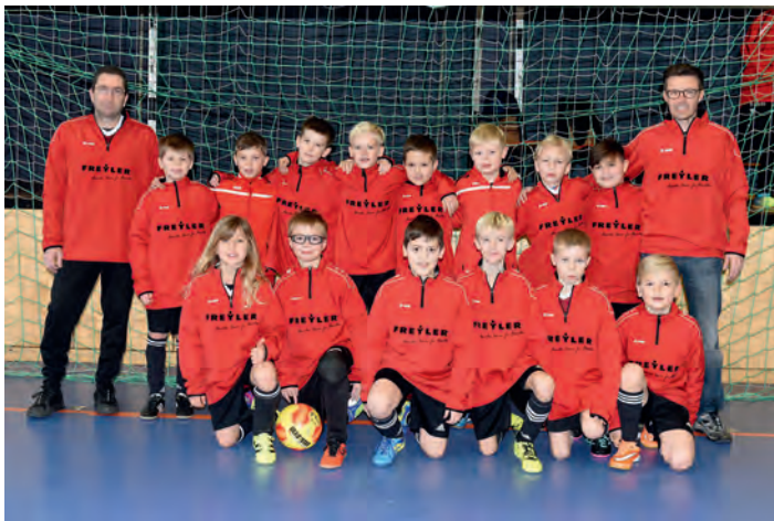
E2: Begeisterndes Spiel in Friedrichstal