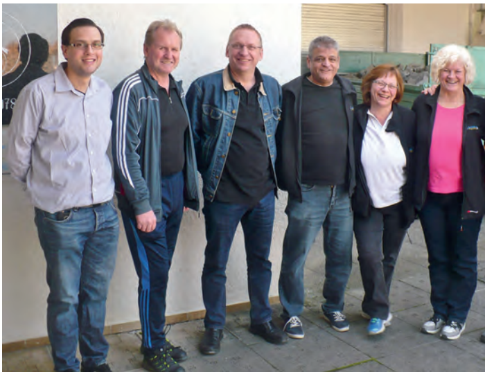
Teilnehmer der Kleinkaliberkreismeisterschaft