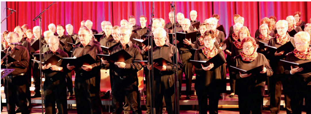
Der Gesangverein „Frohsinn“ begeisterte sein Publikum mit Melodien von Volkslied über schwungvolle Liebeslieder aus den 30er Jahren bis zu englischsprachigen Balladen