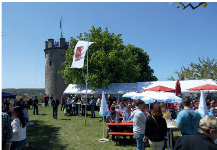
Turmfest des GV Frohsinn am 25.05.2017

Am 25. Mai 2017 veranstaltet der Gesangverein Frohsinn 1886 Weingarten e.V. das traditionelle Turmfest auf dem Gelände am Weingartener Wartturm. Wir werden Sie mit leckeren Speisen und vielerlei Getränken sowie selbstgebackenen Kuchen und Torten verwöhnen. Freunde, Bekannte und die gesamte Weingartener Bevölkerung sind herzlich eingeladen. Der Vorstand und die Mitglieder des Gesangvereins Frohsinn freuen sich auf Ihren Besuch!