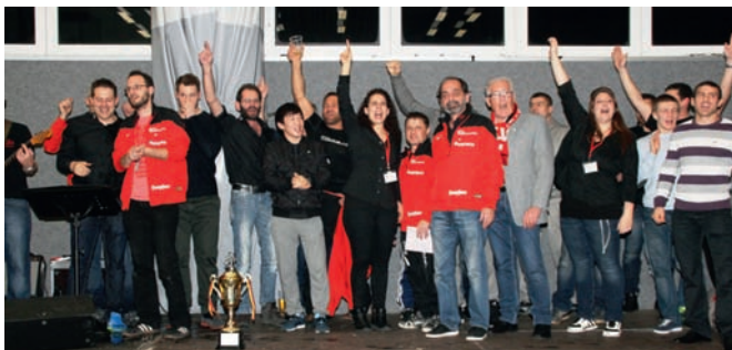
Am Ende des Tages hieß es: Kopf hoch und Blick nach vorn, Shalala SV Germania!