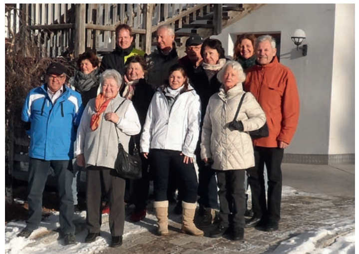
Wintersport und Wandern