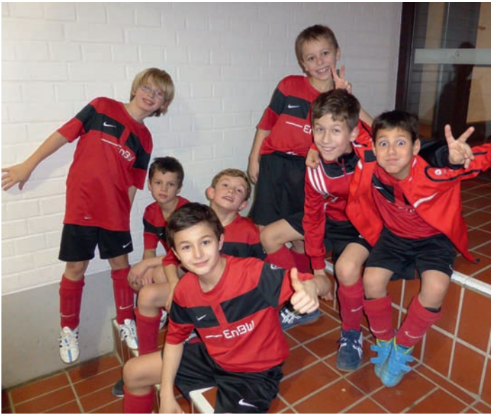
E2-Jugend Saison 2015/2016

lenbegegnungen noch den Kürzeren gezogen hatte. Auch wenn die beiden folgenden Partien teilweise sehr unglücklich gegen Beiertheim und Wettersbach verloren gingen, ließen sich die Jungs nicht unterkriegen und starteten nochmals hochmotiviert in die letzten beiden Partien. Gegen den Lieblingsgegner und spielstarken ASV Hagsfeld musste man sich leider nach zahlreich vergebenen Großchancen mit einem 1:1 Unentschieden zufriedengeben. Zum Abschluss wartete der FC Berghausen, der allerdings an diesem Tag gegen die sehr gut aufgelegten Weingartener keine Chance hatte und sich mit 2:0 verdient geschlagen geben musste. Somit erreichte die Mannschaft mit einer sehr konzentrierten, engagierten und fußballerisch guten Leistung von insgesamt 7 Mannschaften den 3. Platz. Dies wurde dann selbstverständlich, gemeinsam mit dem Trainerteam, mit einem „kleinen Kabinenfest“ gebührend gefeiert.