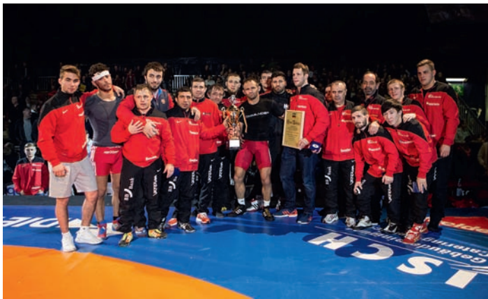
Der SVG wird Vize-Meister 2015/16