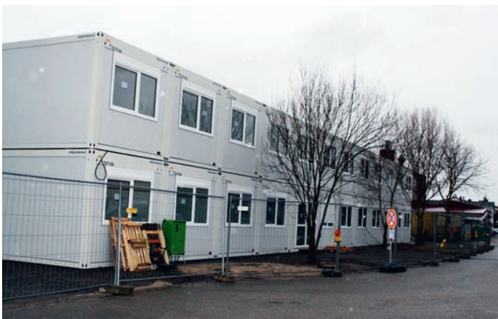
Die Containeranlage „Am Winkelpfad“ ist im Rohbau fertiggestellt. Derzeit findet der Innenausbau statt. Bis März soll sie bezugsfertig sein.