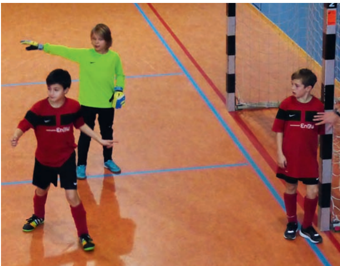
E2 in Aktion