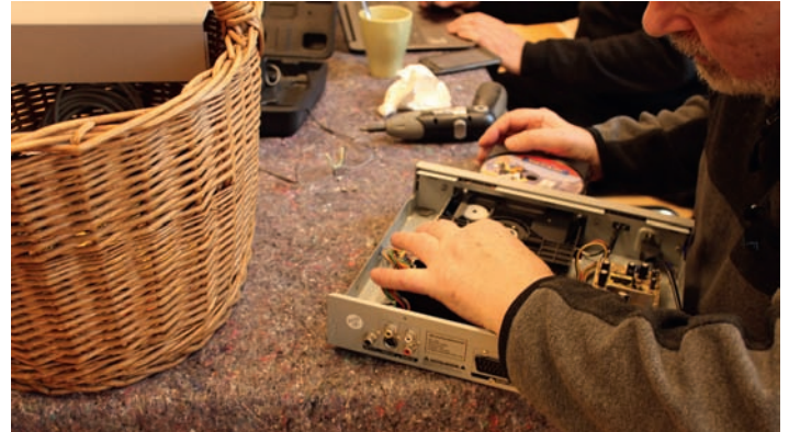
Repair-Café in Aktion. Eine gemeinsame Initiative mit dem Familienzentrum

info@buergergenossenschaft-weingarten.de