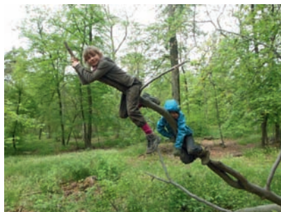
Waldkids