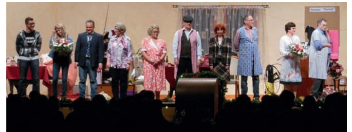
Die Akteure der Frohsinn-Theatergruppe 2016