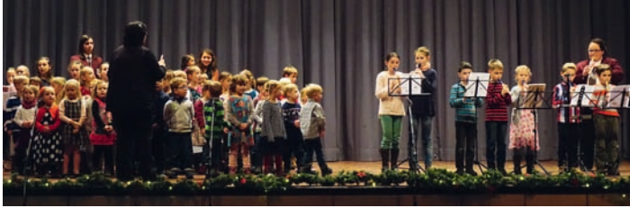
Hier haben unsere jüngsten Musiker ihren Auftritt.

ums als aktive Musiker oder fördernde Mitglieder des Vereins. Zum großen Schlusschor kamen alle Musiker auf die Bühne kamen, um gemeinsam mit dem Publikum Weihnachtslieder zu spielen und zu singen. Wir hoffen, Sie konnten sich die vorweihnachtliche Stimmung mit nach Hause nehmen und wünschen Ihnen ein frohes Fest und ein gutes neues Jahr.