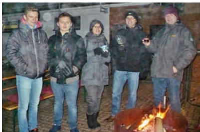
In vorweihnachtlicher Stimmung fand das 1. Nikolausgrillen im Schützenhaus statt.