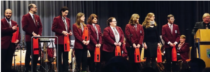
Langjährige Mitglieder wurden geehrt.