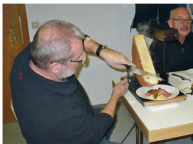
Reihum bekam jeder seinen Käse ab.