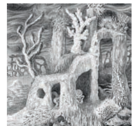
Bleistiftzeichnung von Christina Häber