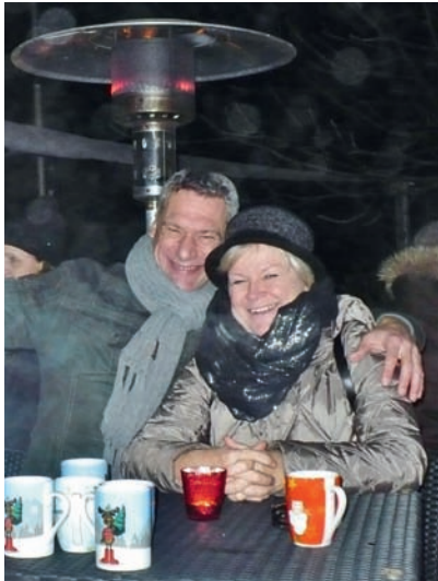
Beste Stimmung unter freiem Himmel.

Zahlreiche Gäste ließen sich die leckeren Grillschmankerl und den köstlichen Glühwein unter freiem Himmel schmecken und nicht selten ging dabei ein Blick gen Himmel, ob nicht doch noch der Nikolaus zu sehen war.