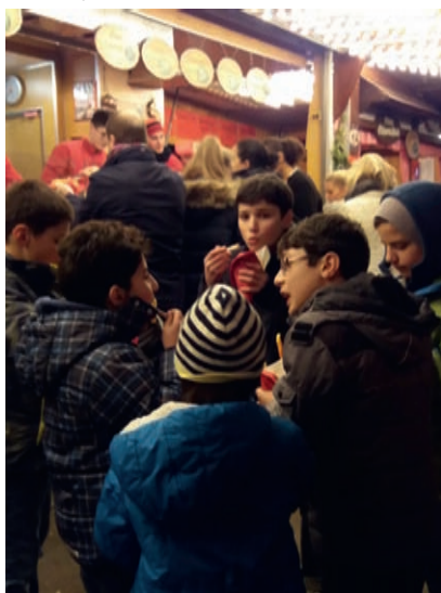
Besuch des Weihnachtsmarktes