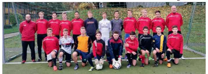
Unsere B-Junioren auf Schöneck