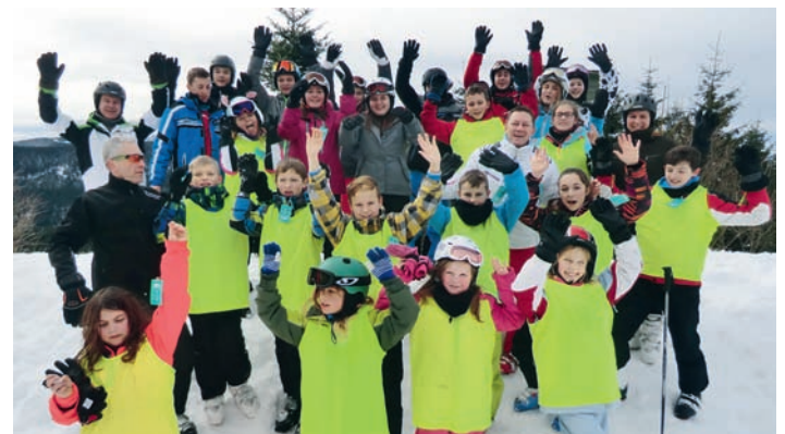
War mal wieder ein tolles Ski-Camp

am 27.02. steigt auf dem Rathausplatz wieder unsere Après Ski Party. Hierzu sind alle wieder herzlich eingeladen. Bitte merkt Euch diesen Termin schon mal vor.