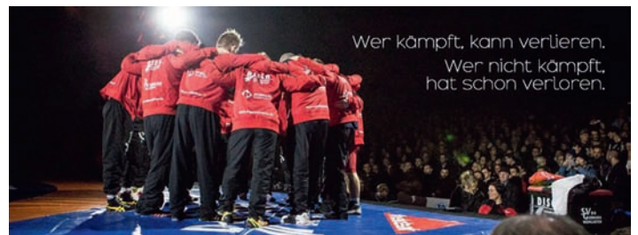
Der SVG gibt den Kampf nicht auf

Es ist wieder einmal eine hohe Hürde, die den SV Germania im Final-Rückkampf um die Deutsche Mannschaftsmeisterschaft am kommenden Samstag im Eventzelt auf dem heimischen Festplatz da erwartet. Mit vier Punkten Rückstand gehen die Weingartener in das zweite Duell mit Titelverteidiger ASV Nendingen. Eine ordentliche Hypothek, doch noch haben sie im Lager der Germanen den Glauben an die Sensation nicht verloren.