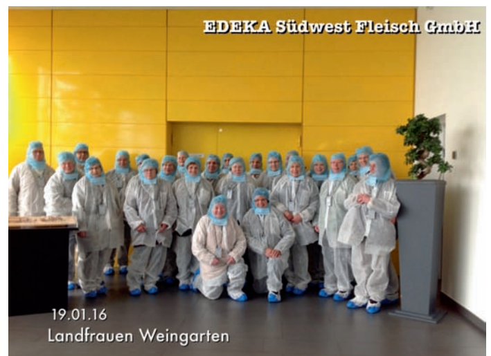
19.01.16 Landfrauen Weingarten