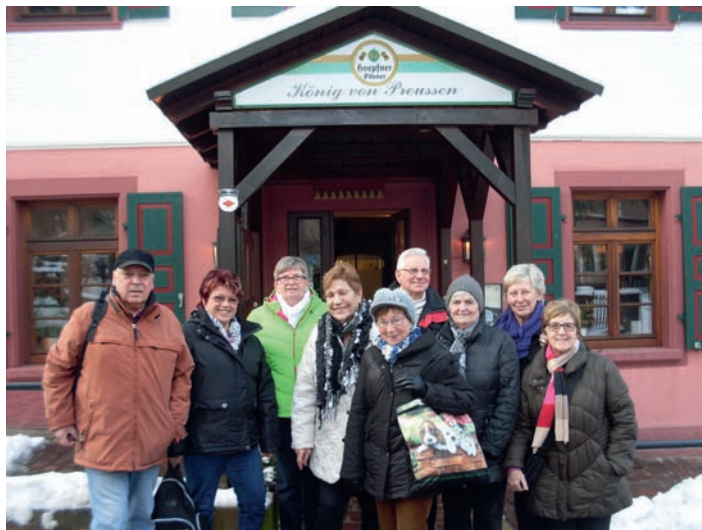
Vor dem König von Preußen