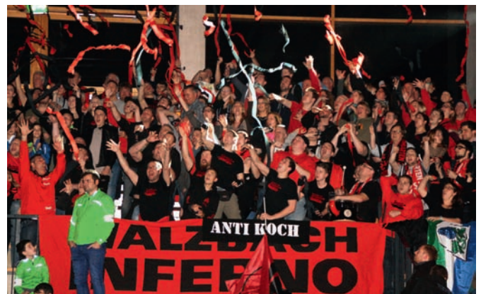
Das Walzbachinferno sorgte mit bunten Papierschlängen gleich zu Beginn für gute Stimmung in der Weingartner Ecke