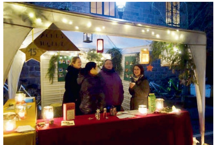
AGNUS-Jugend auf dem Weihnachtsmarkt

Dank den Eltern unserer Wurzelkinder und Grashüpfer konnte die AGNUS-Jugend dieses Jahr wieder am Weihnachtsmarkt teilnehmen. Viele Kinder waren begeistert, die Lehmkartoffeln mit kleinen Überraschungen knacken zu dürfen. Auch Herr Bänzinger hämmerte tatkräftig bei seinem Besuch am Stand. Bewundert wurden die vielen Ideen zu unserem Recycling- bzw. eher Upcycling-Weihnachtsschmuck, besonders die Engel aus einem Deo-Roller. Anleitungen unter http://agnus-weingarten.de/wp/unsere-projekte/recycling/