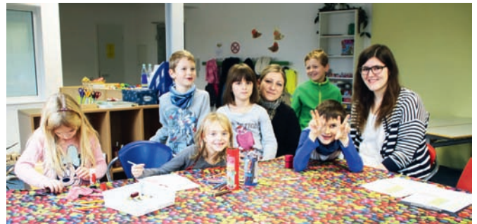
Malen und Basteln gehört zum festen Programm der Kernzeitbetreuung

„Die Kernzeit ist nur eines der Angebote unter der großen Überschrift ‚Schulkindbetreuung‘“ erklärt Schröder. Ihr Klientel sind Kinder, die nur vor und nach der Schule eine kurze Zeit verbringen müssen, während der sonst niemand zu Hause wäre. Sie hat von 7 bis 8.30 Uhr und von 12.15 Uhr bis 14 Uhr geöffnet. Parallel dazu gibt es die „flexible Nachmittagsbetreuung“ von 12.15 bis 15 Uhr, die auch Hausaufgabenbetreuung anbietet. Die längsten Öffnungszeiten in den flexibel buchbaren Modulen ist der „Hort an der Schule“, der eine Betreuungszeit von 12.15 Uhr bis 17.15 Uhr anbietet und außerhalb der Schulzeiten eine Ferienbetreuung. „Mit dieser Schulkindbetreuung, die die Fortsetzung der Kindergärten und Kitas bildet, ha-