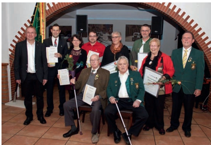
Schützenverein Weingarten ehrt langjährige Mitglieder.