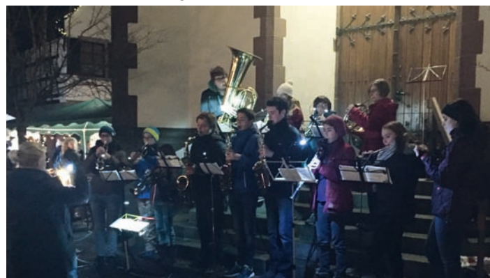
Das Jugendorchester auf dem Weihnachtsmarkt in Weingarten

Euer Musikverein Weingarten (Baden) e.V.