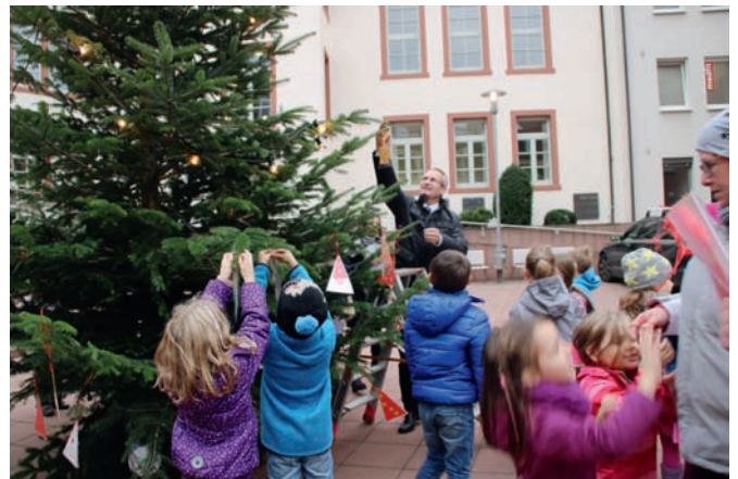
Ein besonderes Ereignis für die Schulkinder ist es, wenn eine Klasse den großen Weihnachtsbaum auf dem Rathausplatz schmücken darf