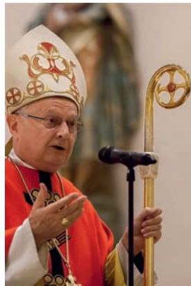
Erzbischof em. Dr. Robert Zollitsch

Die beiden gut besuchten Firmgottesdienste rundeten den Firmweg, der im April 2016 begann, begeistert ab.