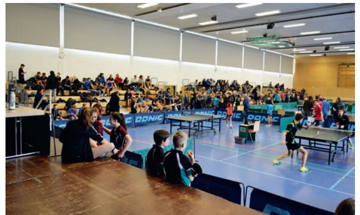
Tolle Stimmung in der gut gefüllten Walzbachhalle