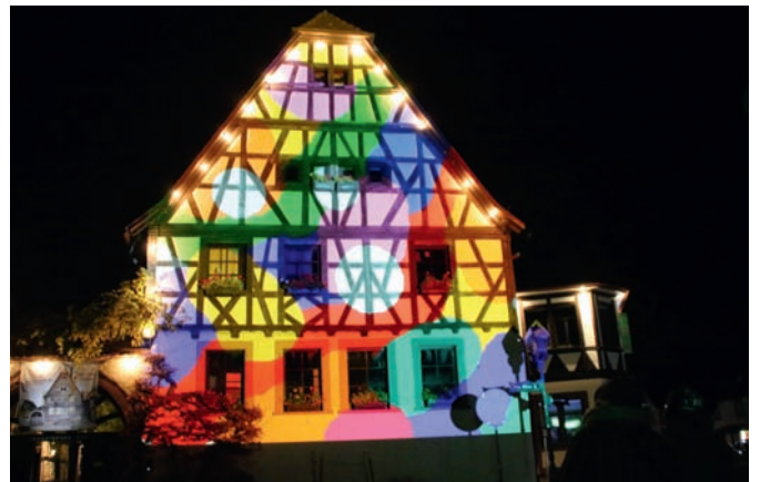
In leuchtenden Farben erstrahlte der Fränkische Hof als Abschluss der vier Monate andauernden multimedialen Ausstellung.

Erdgeschoss der Scheune installierten iPad selbst abrufen konnten. Zusätzlich waren Werke von vier Medienkünstlern zu sehen, die teilweise den Fränkischen Hof als Atelier genutzt hatten und mit Geldern der Stiftung gefördert worden waren. Die Stiftung verfolgt ja das Ziel, Jugend an Technik heranzuführen und ihr über Kunstprojekte die Möglichkeiten der digitalen Welt zu erschließen. Damit sollen Aktivität und Kreativität gefördert und über das bloße Konsumieren gestellt werden. Umso mehr bedauerte Trauboth das offenbar geringe Interesse, das die Bevölkerung seiner Ausstellung entgegengebracht hatte.