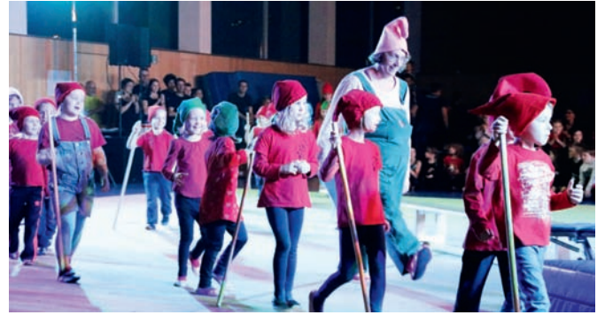
Als niedliche Zwerge schlappten die Kinder in die Halle, um das Märchen von Schneewittchen zu spielen

Ein getanztes Märchen handelte vom „Teufel und dem jungen Mann“, viele kleine Zwerge aus den Weingartner Bergen hatten Schneewittchen am Schlawittchen und Hänsel und Gretel stießen die böse Hexe in den Ofen. Die ausgefeilte Beleuchtung kam vor allem bei den Szenen der Älteren und Erwachsenen zum Tragen. So war sicherlich die Kulisse des Piratenschiffs der Geräteturnerinnen ebenso ein Höhepunkt wie die Petticoat-Nummer der jungen Damen der Turngruppenmeisterschaft. Die Gruppe Schülergruppenwettkampf war mit „Kleine Bestien“ Badischer Schülermeister geworden und die Mädchen des Turngruppenwettkampf flogen als „Elfen“ über den Kasten. Die Gruppen waren zahlenmäßig sehr unterschiedlich, aber auch ganz kleine mit nur sechs oder sieben Mitgliedern finden