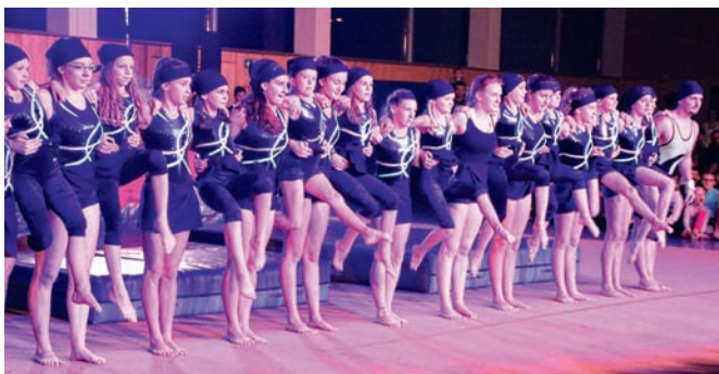
Piratinnen auf hoher See

„Es war einmal...“ hatte der Turn- und Sportverein sein Schauturnen in diesem Jahr betitelt und mit vielen kreativen Einfällen hatten die Übungsleiterinnen daraus einen bunten Reigen von Darbietungen zusammengestellt. Von den Kleinsten bis zu den Erwachsenen waren alle Gruppen vertreten, jede zeigte ein altersgemäß entsprechendes Programm. „Bewegung nach Musik“ war die große Überschrift, unter der etliche Beiträge aus dem Jugendbereich subsumiert werden konnten. Tänze, Bodenakrobatik, fliegende Sprünge über den Kasten waren einige Elemente. Alle Beteiligten sprühten vor Motivation und Begeisterung. Das Publikum ließ sich gerne anstecken und quittierte die Leistungen mit reichlich Beifall. Noch gänzlich ohne das Wort „Leistung“ agieren die Trainerinnen der ganz jungen Kinder ab eineinhalb Jahre, die über Freude an Bewegung an den Sport herangeführt werden. Ziemlich ehrgeizig sind die Kunstturnerinnen am anderen Ende der Skala,