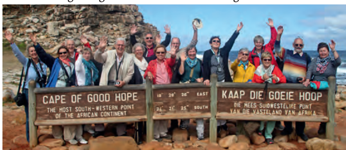
Die Reisegruppe am Kap der Guten Hoffnung

Unser letzter Besichtigungspunkt war der Botanische Garten von Kirstenbosch. Das Frühjahr hatte gerade begonnen, und es blühte überall. Besonders die Proteen waren in voller Blüte. Es fiel uns schwer, von diesem wunderbaren Land Abschied zu nehmen. Erfüllt von vielen Eindrücken kamen wir in Weingarten an. Südafrika war wirklich eine Reise wert!