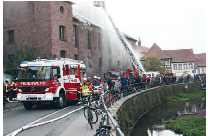
800 Liter Wasser pro Minute wurden über eine Saugpumpe dem Walzbach entnommen, um das „brennende“ Kirchendach zu löschen