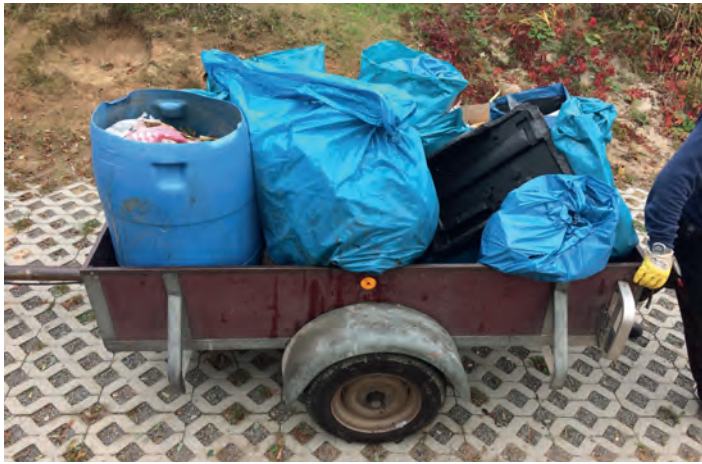
Behinderten- und Rehabilitationssportverein Weingarten e. V.

zwischen schon ein gewohntes Bild. Der Verein hofft wie immer, daß sich das Umweltbewusstsein der betreffenden Seebesucher bessert und so die nächste Seeputzete im Frühjahr ein „schlechtes“ Ergebnis bringt.