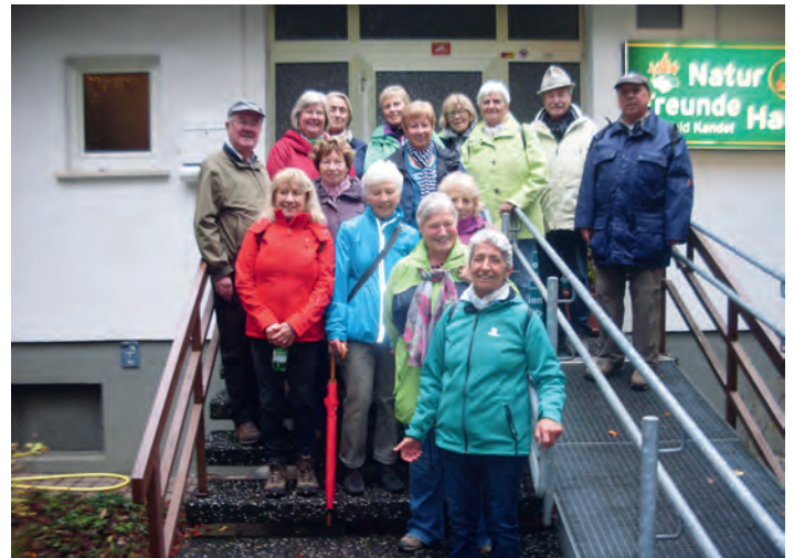
Am Naturfreundehaus Bienwald

Wir machen vom 18. - 20. Mai 2017 eine Bus-Reise in die Schweiz. Im Reisepreis eingeschlossen sind: die Fahrt im modernen Reisebus, Unterkunft im 3*** Hotel, 2x Übernachtung, 2x Halbpension. Fahrt mit dem Bernina-Express und Besuch der Via Mala Schlucht (Änderungen vorbehalten). Im Doppelzimmer pro Person 329,- €, Im EZ 384,- €. Anzahlung 100,- €. Nähere Einzelheiten auf unserer Homepage http://www.tsv-weingarten.de/Anmeldung erbeten bei Peter Spohrer (mail. peterspohrer@web.de ) oder Tel. 07244 2618. Wanderung am Sa 12. Nov. zu der Thingstätte Heidelberg Die für den 05.11. geplante Wanderung wird auf Samstag den 12.11. verschoben. Treffpunkt ist um 8:45 Uhr am Bf. Weingarten (Ost), Abfahrt 9:02 Uhr. Es ist eine leichte bis mittelschwere Wanderung von 12 km mit knapp 400 Höhenmetern auf guten Waldwegen. Eigenverpflegung für unterwegs. Abschließende Einkehr-