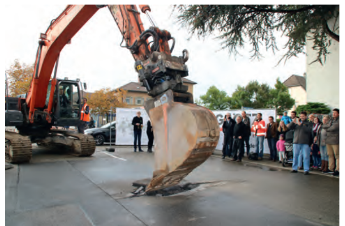
Mit eigener Hand steuerte Bürgermeister Bänziger den Bagger, um den ersten Biss zu vollziehen: Die Sanierung hat begonnen!

waltung in das Vorhaben einbezogen und in mehreren Informationsveranstaltungen haben Bürgermeister Eric Bänziger und die Planerin Elke Gericke die Fakten vorgetragen und die Fragen beantwortet. Auf 190 Meter Länge werden die Verkehrsflächen erneuert. Das Abwasser wird von einem Misch- in ein Trennsystem überführt und die teilweise bis zu 80 Jahre alten Frischwasserleitungen werden durch glasfaserverstärkte Kunststoffrohre werden ausgetauscht. Im selben Zug werden weitere Versorgungsleitungen sowie Breitbandkabel verlegt. Der künftige Querschnitt der Straße wird weitestgehend auf 6,20 Meter ausgebaut, nur an einer Schmalstelle auf 5,90. Eine ansprechende Gestaltung mit Straßenbäumen und einer durchgängigen Gehwegbreite von 1,50 Meter, die auch rollator- und kinderwagengerecht sein soll, bildet den Abschluss. Diskussionen gab es um die teilweise Inanspruchnahme der Vorgärten, aber auch das sei mit einem zufriedenstellenden Kompromiss gelöst worden, sagte Bänziger. Der Eingriff sei nicht ganz unvermeidlich, werde aber gering gehalten.