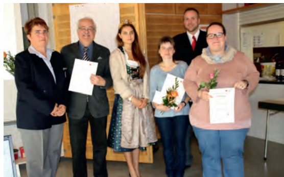
DRK Ehrungen ab 25 Jahre Zugehörigkeit