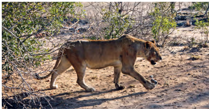
Ein Löwe aus nächster Nähe

nächsten Morgen fuhren wir in das ehemalige Goldgräber-Dorf Pilgrim's Rest. Hier scheint die Zeit stehen geblieben zu sein. Unser nächstes Ziel war das berühmte Naturreservat um den Blyde River Canyon. Hier hat sich der Blyde River eine 600 m tiefe Schlucht gegraben. Als am nächsten Morgen die Sonne aufging, fuhren wir im offenen Geländewagen in den Krüger Nationalpark. Und schon stand eine Elefantenkuh mit ihrem Baby am Wegrand. Schon bald sahen wir an einem Wasserloch Löwen, die einen Büffel gerissen hatten. Giraffen, Zebras, Impalas, Nashörner, Flusspferde, Büffel, Elefantenherden und immer wieder Löwen sowie die vielfältige Vogelwelt bezauberten uns.