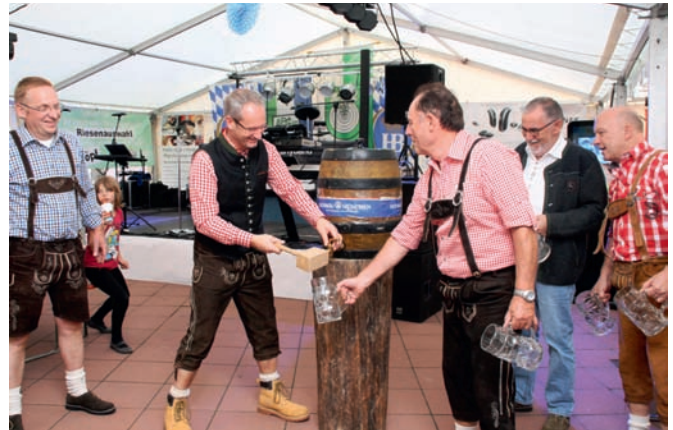
Mit einem Schlag saß der Zapfhanh!