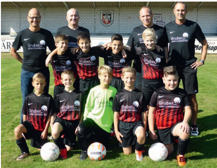
E1-Junioren mit neuem Outfit

Nachdem das erste Spiel in Eggenstein unglücklich mit 4:5 verloren ging, trat man am vergangenen Samstag zu Hause im Waldstadion gegen den SV Blankenloch an. Im neuen Outfit, gesponsert von der Firma Gruber Garten- und Landschaftsbau aus Weingarten, erspielten sich die Jungs des FVgg Weingarten recht schnell spielerische Vorteile und führten verdient zur Pause mit 2:1. Trotz einiger Umstellungen von Blankenloch blieb man auch in Hälfte 2 überlegen und hatte eine Vielzahl an Großchancen, die man leider leichtfertig vergab. Erst in den letzten 5 Minuten des Spiels erzielten die Weingartener die weiteren Treffer zum letztendlich aufgrund der Chancenverteilung hochverdienten 4:1 Sieg. Am kommenden Wochenende fährt man zum starken Gegner FC Friedrichstal und hofft auch dort etwas Zählbares mitnehmen zu können.