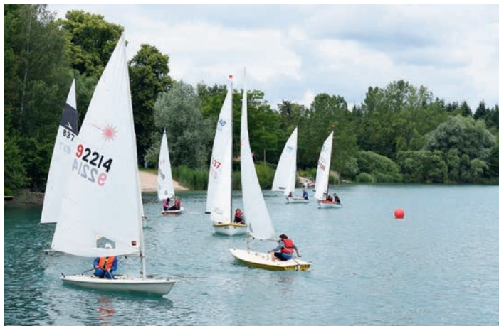
Zweite Regatta 2016

Am Sonntag, den 11. September 2016 findet die dritte Segel- und Surfregatta statt. Beginn der Segelregatta ist um 10 Uhr, Beginn der Surfregatta um ca. 13.30 Uhr. Meldungen für die Regattateilnahme müssen bis eine halbe Stunde vor Startbeginn erfolgt sein. Die Segel- und Surferte freuen sich auf eine rege Regattateilnahme.