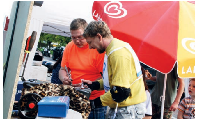
Im Fahrerlager wird oft während des Rennens noch das eine oder andere optimiert oder auch repariert. Der Schraubenschlüssel ist immer dabei.

Am Samstag beginnt um 12 Uhr das „Warm-up“, ab 14 Uhr werden die Teilnehmer in vier Startklassen gegeneinander antreten. Die Bambinis (7-11 Jahre) beginnen um 14 Uhr, die Amateure (12-99 Jahre) um 14.45 Uhr, die „Fun“ (12-111 Jahre) um 15.30 Uhr und die Profis, die ausschließlich mit aufgemotzten Bobbycars antreten dürfen, um 16.15 Uhr. Ansprechpartner ist Leon Winheim unter der Adresse leon.winheim@ec-weingarten.de .