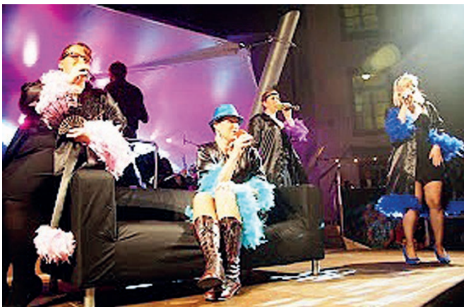
Engagierte Musiker präsentieren in pfiffiger Darstellung Stars und Hits. Wer gewinnt den heiteren Wettstreit?

Ein weiteres Mal werden am 3. und 4. September Musik, Wein und Natur in Weingarten unter dem Titel „Musik und Wein“ unter der Regie des Musikvereins eine einzigartige Verbindung eingehen und die Besucher ein genussvolles Event erleben lassen. Das Fest beginnt am Samstagabend um 18 Uhr auf dem Rathausplatz mit der musikalischen Eröffnung durch den Musikverein Karlsdorf. Ab 20 Uhr steigt dann der Klassiker des Musikvereins Weingarten: Die allseits beliebte Hitparade. Zehn Titel werden live von Musikern des Vereins mit großartiger Show, begleitet vom Klang des Blasorchesters, als pfiffiges und amüsantes Open Air Konzert dargeboten. Eine Vielfalt an kleinen feinen Speisen und Getränken