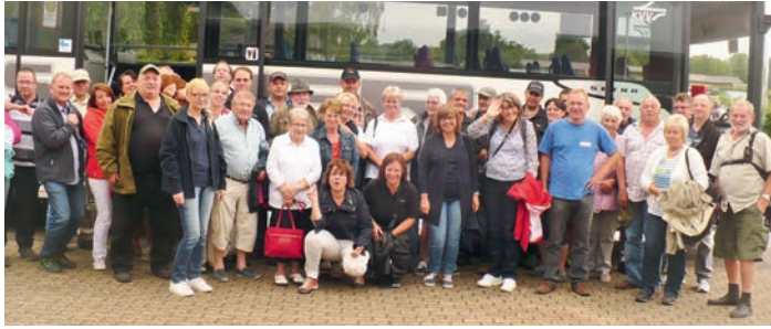
Abschluss des Ausfluges