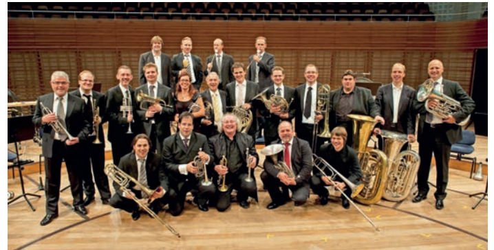
Brass Ensemble des LUCERNE FESTIVAL ORCHESTRA

www.weingartner-musiktage.de/festival/tickets