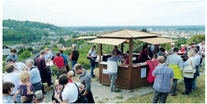
Beim Weinwandertag am Probiertand

Der zweite Tag ist der traditionelle Weinwandertag, der auf geführten Wanderungen durch erfahrene Winzer die Reblandschaft erschließt. Alle Wanderungen in unterschiedlicher Länge, Zeitdauer und Streckenführung beginnen zwischen 10.30 Uhr und 12.45 Uhr im Grundschulhof.