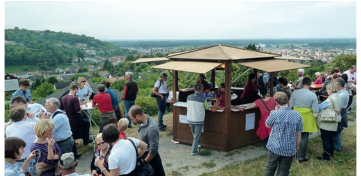
geführte Wanderung durch die Weinberge

lenz: Zehn Titel werden live von Musikern des Vereins mit großartiger Show, unterstützt vom satten Sound des Blesorchesters und mit professioneller Licht- und Tontechnik in Szene gesetzt. Wir laden Sie ein zu einer Zeitreise durch die Musikgeschichte und über die Kontinente. Es stellen sich der King of Pop mit „Thriller“ und „Beat it“ sowie aktuelle Hits aus Deutschland und der Welt zur Wahl um Platz 1. So spielen wir für Sie mit Andreas Gabaliers Song „Hulapalu“ einen der bekanntesten Hits des vergangenen Jahres und den schönen Pop Song „Valerie“ von Amy Winehouse. Vielfältiges Speisen- und Getränkeangebot &amp; Bar