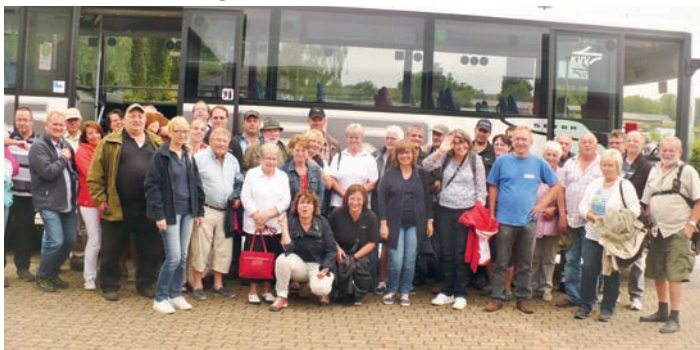
Gemeinsamer Ausflug der Schützen und Jagdhornbläser Waidmannsheil.