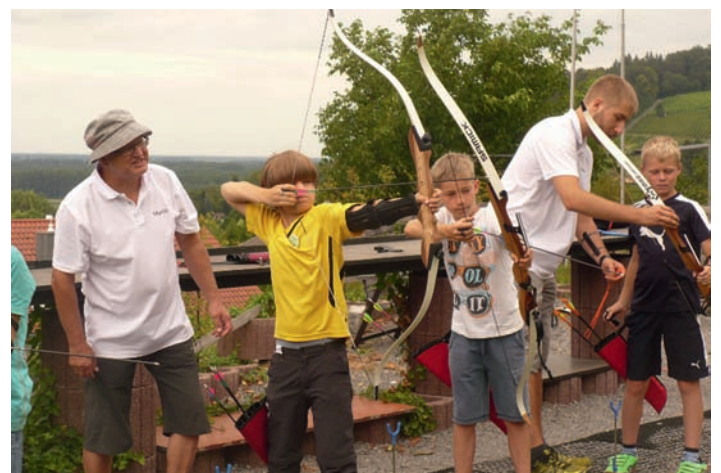
Manchem stand die Anstrengung ins Gesicht geschrieben.