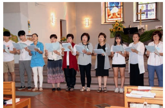
Die koreanischen Gäste hatten auch ein Lied in deutscher Sprache eingeübt