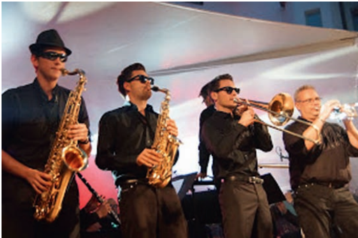
Impressionen von der Hitparade 2014

Weitere Informationen finden Sie auf www.musikverein-weingarten.de oder auf Facebook.