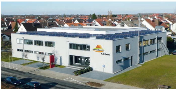
VVK in der Mineralix-Arena

- Donnerstag, 8. September (20 - 22 Uhr): Dauerkarten-Verkauf restliche freie Plätze / Beginn Tageskartenverkauf (Dauerkarten erhältlich bis 1. Heimkampf)