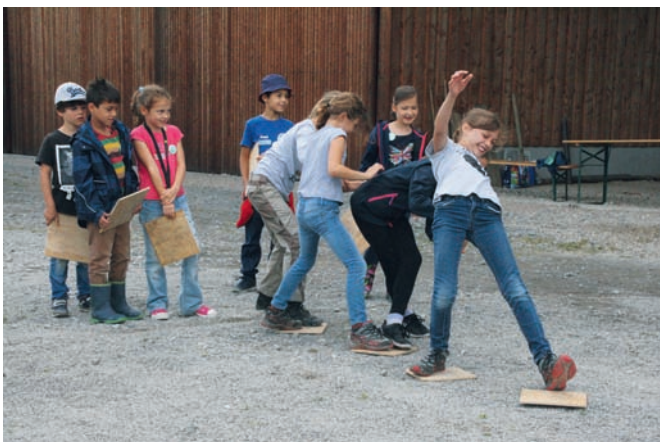
Fairness und Zusammenhalt, Geschicklichkeit und Cleverness zeichnen eine Räuberbande aus. Mit gemeinsamer Problemlösestrategie ging es über den „reißenden Fluss“ und keiner wurde zurückgelassen.

hand kleiner Brettchen in Sicherheit bringen, aber: „Wenn ihr auf dem ‚Wasser‘ seid, müsst Ihr Euch aneinander festhalten. Die Kette darf nicht abreißen“, lautete die Regel. Da war eine Problemlösestrategie gefragt und mit viel Hangeln, Strecken und Drängeln war auch das geschafft. Eine Aufgabe zum Training des Wiedererkennens war, Pflanzen und Früchte auf einer weißen Decke fünf Sekunden anzuschauen und dann in der Umgebung wieder zu finden. Donnerwetter, das war echt schwierig. Das „Waldmobil“ ist eine Initiative der Schutzgemeinschaft Deutscher Wald und bietet Umweltpädagogik für Kinder vor Ort. Ein Fahrzeug dient als Basisstation für Aktivitäten in der Natur. Im Vordergrund steht die Anregung zu eigener Forschertätigkeit. Nähere Informationen erteilt der Landesverband Baden-Württemberg e.V. unter www.sdw-bw.de .