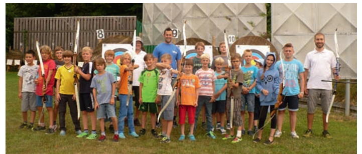
Ferienstpaß beim Schützenverein

Jugendtraining Luftgewehr: mittwochs ab 18 Uhr im Schützenhaus Jugendtraining Bogenschießen: samstags 14 - 15 Uhr Bogenplatz beim Schützenhaus