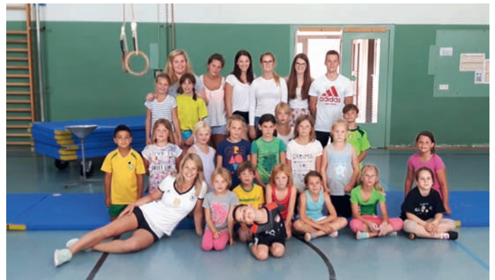
Ferienspaß-Kids und Betreuer

Teilnehmer sowie Jugendausschuss freuen sich schon auf die nächsten bevorstehenden Veranstaltungen.