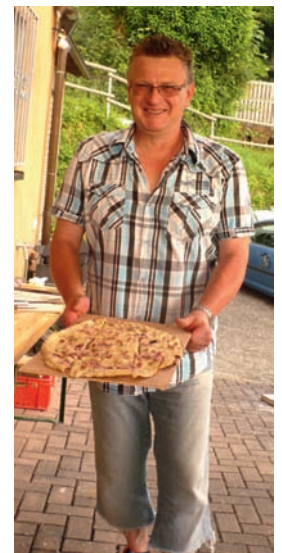
Egal ob klassisch, deftig oder süß es war für jeden etwas dabei.

Während die einen es lieber klassisch mit Speck und Zwiebeln mögen, bevorzugen die anderen lieber eine deftige, scharfe oder süsse Variante.