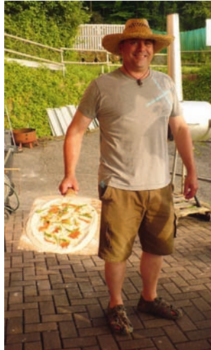
Die Gourmetköche ließen keine Wünsche offen und zauberten die tollsten Flammkuchenkreationen.

Bis tief in die Nacht saßen wir so in fröhlicher Runde zusammen und planten dabei auch schon das nächste Monatstreffen (5. August). Eins kann ich euch dazu bereits verraten: kulinarisch wird es in den Süden gehen.