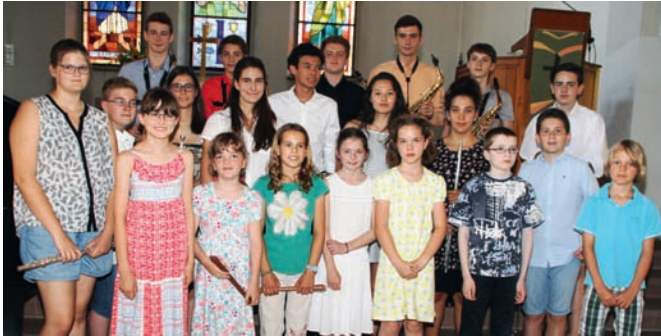
21 Kinder und Jugendliche aus Weingarten präsentierten am Sonntag mit großer Freude und Motivation ihre Fortschritte auf ihren unterschiedlichen Instrumenten, die sie bei der Jugendmusikschule Unterer Kraichgau e.V. Bretten erlernen.