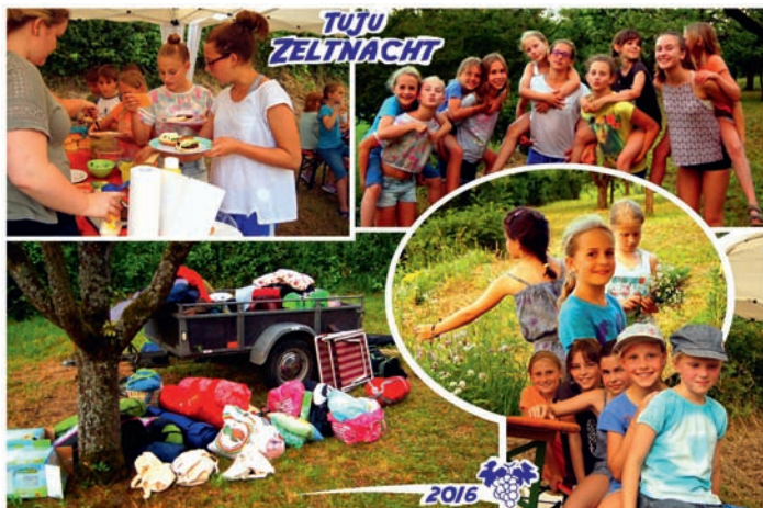
Impressionen von der Tuju-Zeltnacht 2016

Hier ein paar fotografische Eindrücke von der Zeltnacht der Turnerjugend, die vom in der Nacht doch noch einsetzenden Regen und Gewitter gestört wurde. Eine Evakuierung war unausweichlich. Neben anderen Programmpunkten war dies für die Kinder auch ein besonderes Ereignis. Herzlichen Dank an den Jugendausschuss für die Durchführung des Events und an die Eltern, die mit ihren PKW für die sichere Rückkehr der Kinder in den Ort sorgten.