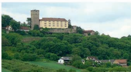
Gutenberg in Haßmersheim