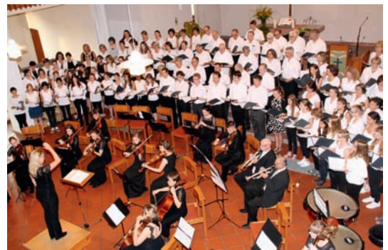
1998 wurde der TMG-Chor gegründet. Seither singen zahlreiche Schülerinnen und Schüler aus Weingarten in dieser großen anspruchsvollen Chorfamilie mit. Seit über zehn Jahren besteht eine Kooperation mit dem Jugendkammerorchester St. Petersburg, einem der renommiertesten Jugendorchester Russlands.