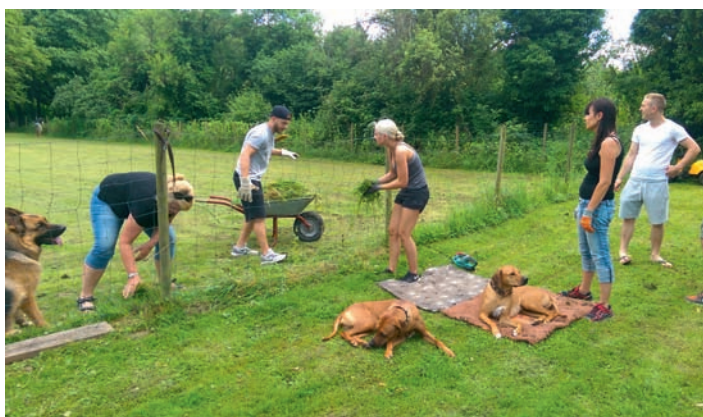
Die Vierbeiner überwachen die Arbeit der Zweibeiner