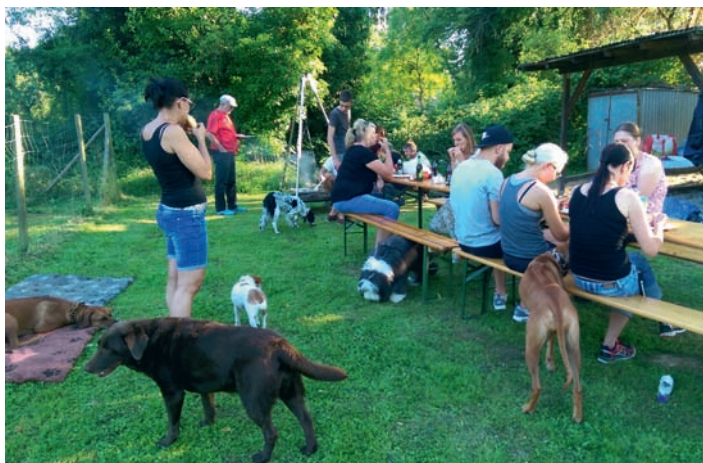
Und nach der Arbeit wird natürlich gemeinsam gegrillt!