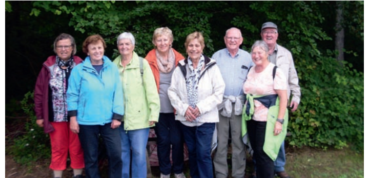
Die Schirme wurden versteckt

Nächste Seniorenwanderung ist am Donnerstag, den 21.07.2016. Näheres siehe TBR.