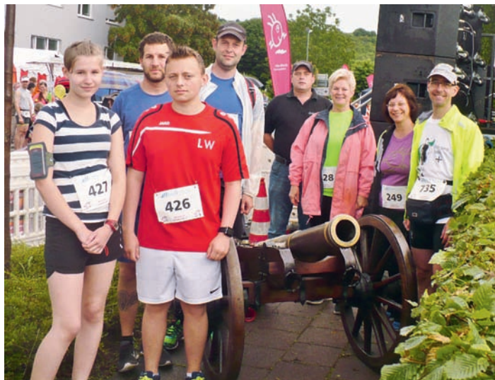
Das Läuferteam des Schützenvereins Weingarten.

Klar, dass wir auch im nächsten Jahr wieder mit dabei sind, wenn es wieder heißt „laufen, walken geben - für die Chance auf Leben“.