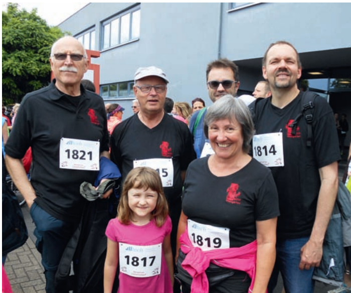
GV Frohsinn: Läufergruppe beim Lebenslauf 2016