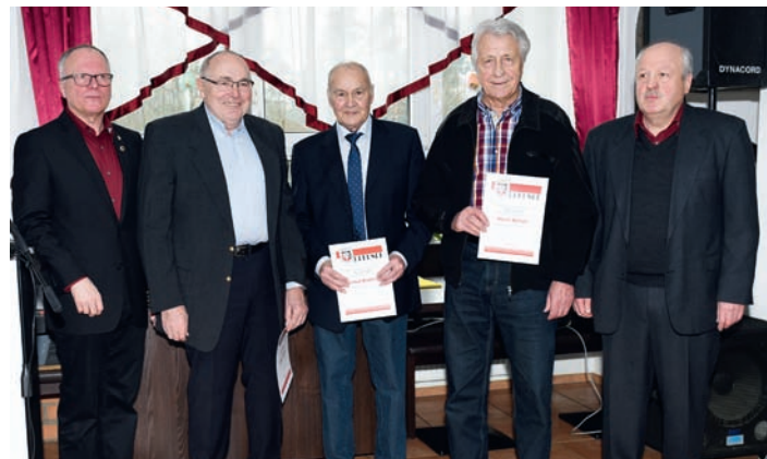
Ehrungen Ü-70 Mitgliedschaft