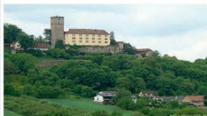
Gutenberg in Haßmersheim