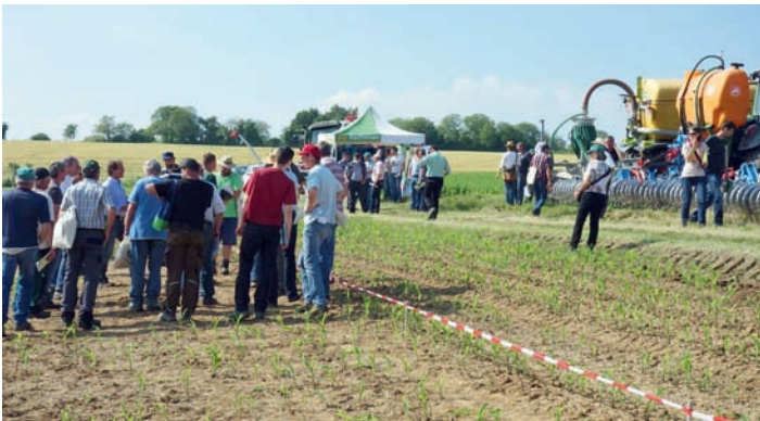
Interessierte konnten sich an verschiedenen Stationen informieren.

Ein Rahmenprogramm zur Düngung und aktuelle Informationen zur anstehenden Novelle der Düngeverordnung rundeten das Angebot ab.