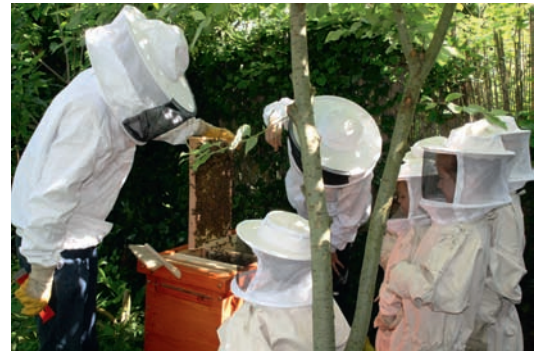
Gut geschützt mit Imkerhut und -anzug konnten die Kinder Bienen im Stock aus der Nähe betrachten