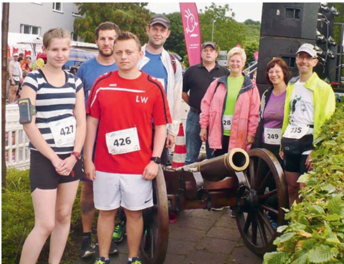
unsere Läuferinnen und Läufer

https://de-de.facebook.com/SPDWeingartenBaden