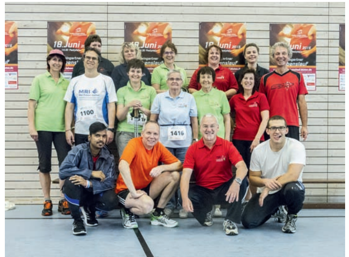
Das Team des Liederkranz 1862 Weingarten e.V. beim Lebenslauf letzten Samstag

Donnerstag 19.00 Uhr Frauenchor und ab 20.15 Uhr Männerchor Alle Proben finden - falls nicht ausdrücklich anders angegeben - in der Mineralix-Arena statt