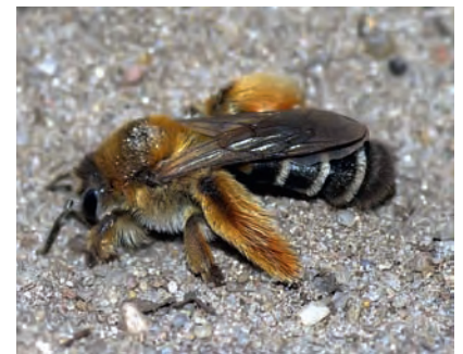
Weibchen einer Hosenbiene

Alle Kinder brauchen wie immer einen Rucksack mit 2. Frühstück und Trinken. Für den Bau eines Wildbienenhoteles soll jedes Kind eine große leere Konservendose mitbringen wie sie z.B. für Suppen oder Gemüse üblich sind.