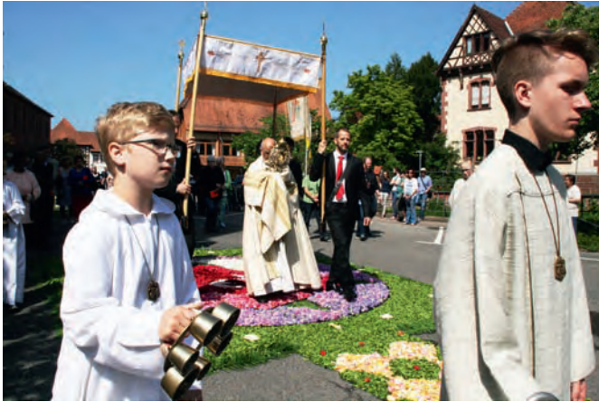
Die Prozession wandert durch die Karlstraße und die Apothekenstraße zurück über die Marktbrücke zur katholischen Kirche. Erst in der Kirchstraße beginnt der Blumentepich, den nur der Pfarrer mit der Monstranz betreten darf.