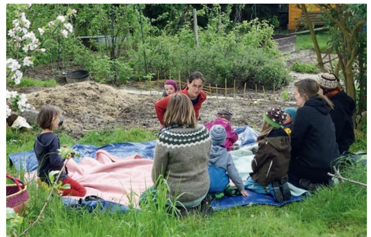
neue Gruppe der AGNUS-Jugend