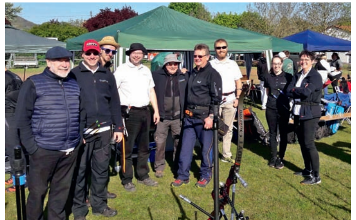
Die Teilnehmer des Siebeldinger Bogenturniers.

Gefeiert wurden die zahlreichen Erfolge natürlich standesgemäß in einer Pfälzer Weinstube bei einem Schoppen und gutem Essen. Wir gratulieren recht herzlich zu dieser tollen Mannschaftsleistung und wünschen für die weiteren Turniere weiterhin „alle ins Gold“.