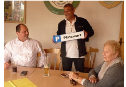
Der „Multifunktionsparkplatzschild“ wird erläutert.

Zum gemeinsamen Mittagessen traf sich die gesamte Gruppe im Schützenhausrestaurant „Il Vigneto“. Bei italienischen mediterranen Gerichten und Weingartner Weinen ließ man den Tag in froher Runde ausklingen.