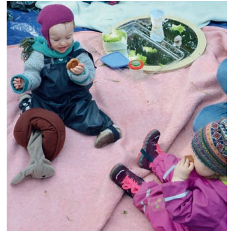
Beim Erkunden der Schnecke