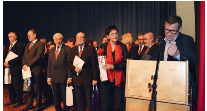
Gesangverein Frohsinn 1886 e.V. Weingarten - Ehrungen

Herzliche Glückwünsche, und vielen Dank für die tatkräftige Unterstützung!