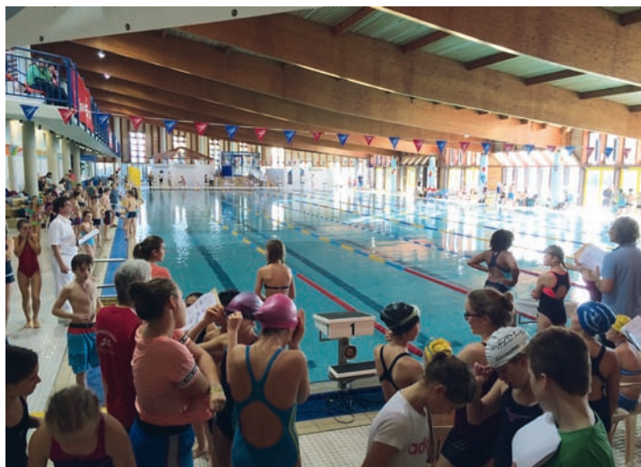
Schüler der Gemeinschaftsschule bei den Schüler-Schwimm-Meisterschaften 2015