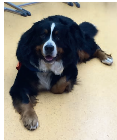
Schulhund Joko besucht die Turmbergschule

Vielen Dank für deinen Besuch Joko! Wir freuen uns bereits auf's nächste Mal!