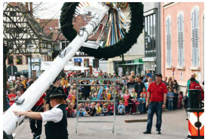
Auch nach rund 35 Jahren findet das Aufstellen des Maibaums immer noch das Interesse von alt und jung