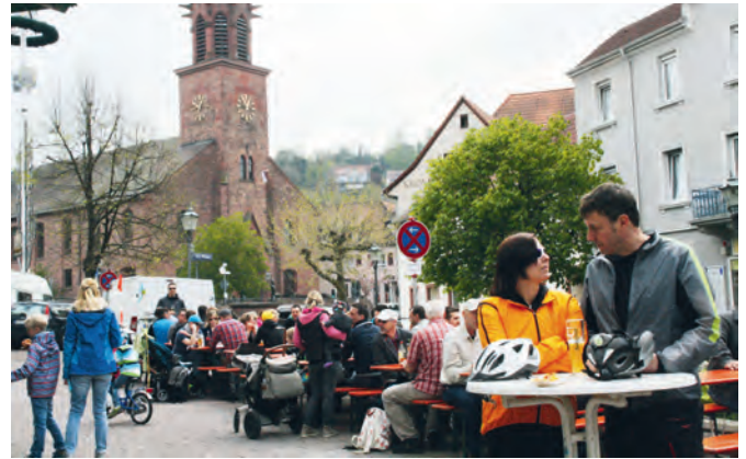
Das erste Fest der neuen Freiluftsaison wird gerne wahrgenommen

kuläres Schauspiel, wenn der Kran den rund 12 Meter hohen Stamm hochzieht, und für alle ein hochwillkommener Treff und sozusagen die Eröffnung der Freiluftsaison. Ruckzuck waren die Bänke entlang des Walzbachs gut besetzt und der Bierhahn lief. Die Weinhoheiten unterstützten den Ausschank am Weinbrunnen und der Grill lag am Samstagabend in den bewährten Händen der Metzgerei Kunzmann. Am Sonntag übernahm dann der TSV das Ruder. Er eröffnete mit einem klassischen Weisswurstfrühstück, bevor der Tag ein Ziel für „alle Wanderfreudigen und Fahrradfreunde“ sowie ein Gaumenfreudentreffpunkt für „Fast-foodjunkies und Genussmenschen, Herzhaftfreunde und Süßmünder“ wurde.