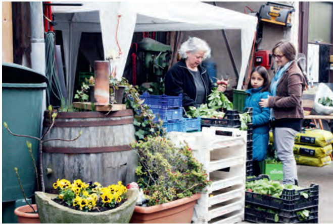
Die „SoLawi“ hat nach wie vor ihre Ausgabestelle der Gemüseanteile auf dem Höhenfelder Hof und heißt weiterhin „Gutes Gemüse“. Jeden Samstag können Ernteanteile abgeholt werden.

Am 7. Mai ab 9 Uhr gibt es auf dem Rathausplatz zum zweiten Mal einen Jungpflanzenmarkt. Jedermann kann kommen und junge Pflanzen anbieten, tauschen oder gegen eine Spende erwerben. Neu: Organisator ist nicht mehr „Gutes Gemüse e.V.“, sondern „flurkultur. Initiative für nachhaltige Entwicklung e.V.“. Was hat sich geändert?