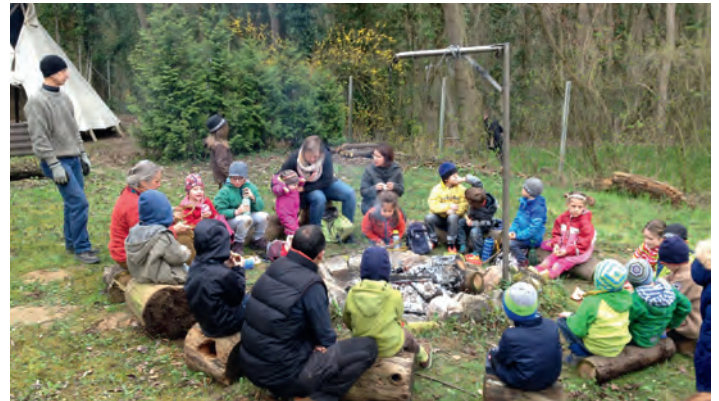
AGNUS-Jugend-Indianer um die Feuerstelle

Die Indianer lebten in und mit der Natur auf eine sehr achtsame, nachhaltige Weise. Ihr Respekt gegenüber allen Lebewesen drückte sich ganz verschieden aus. So ernteten sie von Pflanzen nur so viel, wie sie derzeit brauchten und dass die Pflanze überlebt. Gejagte Tiere wurden möglichst vielseitig und in allen Teilen verarbeitet. Zudem dankten sie mittels einer rituellen Handlung der Pflanze oder dem Tier, indem sie der Natur etwas zurück gaben. In diesem Sinne bietet der Rahmen eine breite Vielfalt für unsere Themen Natur- und Umweltschutz.