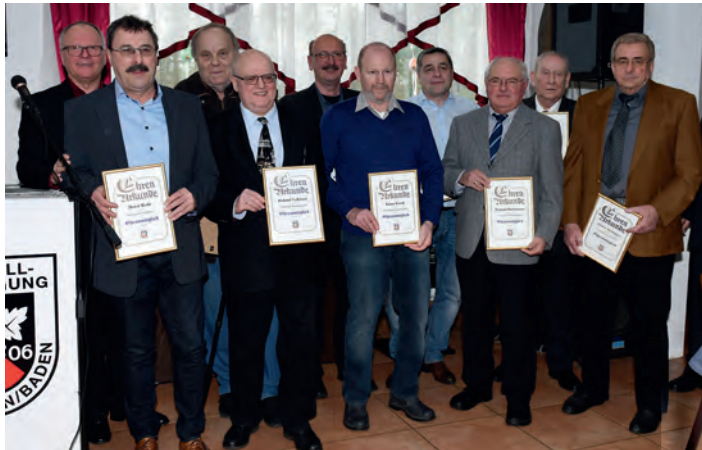
Ehren Matinee: Ehrenmitglieder: