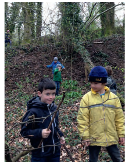
AGNUS-Jugend-Indianer beim Holz sammeln

Im September ging es dann endlich los. An zwei Terminen trafen wir uns auf dem Spielplatz, um auf dem Weg zum Grundstück Spuren in der Natur zu lesen und Müll einzusammeln (Stichwort Littering). Dort sangen wir das Lied „Uns gehört nicht die Erde“ und wurden mit einem Räucheritual gereinigt. Die Kinder konnten einer Geschichte über die Alraun und die Pustelblume im Tipi lauschen, banden sich Kräuter-Sticks und bauten ein kleines Tipi. Sie machten aus Astgabeln und gesammelten Kronkorken eine Rassel und bastelten Namen-Medallion und Stirnbänder aus Naturmaterialien.