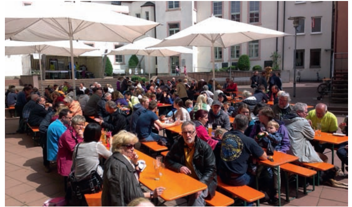
Maifest 2014

Die Kuchenspenden können am 1. Mai ab 9 Uhr auf dem Rathausplatz abgegeben werden. Die Helfer/innen möchten sich bitte rechtzeitig zu ihren Schichtzeiten am jeweiligen Stand einfinden. Wir wünschen uns allen ein harmonisches und wetterfreundliches Fest.