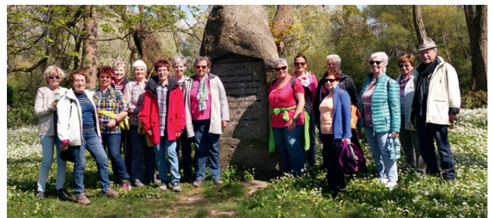
Am Tulladenkmal in Knielingen

Bei strahlendem Sonnenschein und sommerlichen Temperaturen machten sich 16 Wanderer am 21.04.2016 auf den Weg von der Tullabrücke in Weingarten zum Tulladenkmal in Karlsruhe, getreu dem Motto wenn Engel reisen lacht der Himmel. Die Stadtbahn brachte uns nach Maximiliansau. Über die Rheinbrücke schwankten wir auf die badische Seite des Rheins nach Maxau zurück. Weiter ging's zu einem Rastplatz direkt am Fluss wo wir unseren Aperitif einnahmen. Danach gab's Mittagessen im Schiffsrestaurant „Vater Rhein“. Nach der Stärkung wanderten wir direkt am Rheinufer entlang bis zur Hafensperre. Zurück ging's über den Damm, vorbei am Tulla-Denkmal und ein Stück am Knielinger See entlang. Vor der Rückfahrt krönte noch eine Kaffeepause im Hofgut Maxau den Ausflug. Fazit: Es war ein sehr schöner Tag. Nächste Seniorenwanderung ist am 19.05.2016. Näheres siehe TBR.