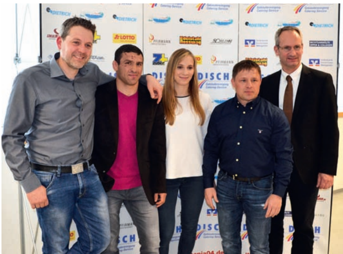
Empfang der Olympioniken in der Mineralix-Arena