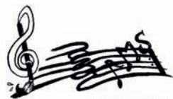
Jugendmusikschule Unterer Kraichgau e.V. Bretten

Die einzelnen Werke werden mit einer kurzen Einführung vorgestellt. Zu diesem außergewöhnlichen Konzert laden die Ausführenden sehr herzlich ein. Der Eintritt ist frei.