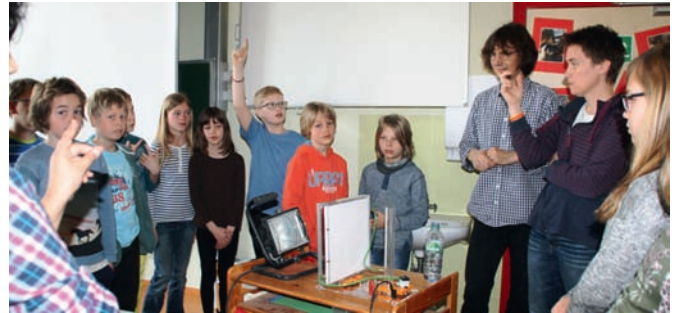
Wasser wird - beispielsweise mit Sonnenenergie - erhitzt, in einen Kreislauf gepumpt, gibt dort die Wärme an die Raumluft ab und kehrt abgekühlt in den Wärmetauscher zurück

Das zeigte er an einem Experiment, das die Kinder selbst erproben durften. Eine - in diesem Fall mit Strom betriebene - Pumpe pumpt kaltes Wasser durch ein Rohrsystem, welches von einer Lampe - als Ersatz für die Sonne - angestrahlt und erwärmt wird. Das Wasser erhitzt sich und gibt die Wärme nach außen ab. Nach ausführlicher Erklärung, dass das warme Wasser von oben durch den Heizkörper fließt, abgekühlt unten wieder heraus und durch die Leitung zurück in den Wärmetauscher, war