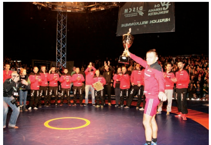
Fans und Sportler haben gemeinsam eine tolle Saison erlebt, die Ringer bedanken sich bei den Zuschauern: „Vielen Dank für eine geile Saison“

„Wir haben Mömbris und Köllerbach geschlagen und damit haben wir schon eine tolle Leistung gezeigt. In einem Finale entscheiden Nuancen. Gemessen an dem Aufwand, den wir getrieben haben, bin ich zufrieden, auch wenn es nicht geklappt hat.“ Dann rief er jeden einzelnen Sportler zu sich und hatte für jeden ein persönliches Wort, nicht minder Lob und Dank an sein Team von Trainern und Vorstandsmitgliedern.