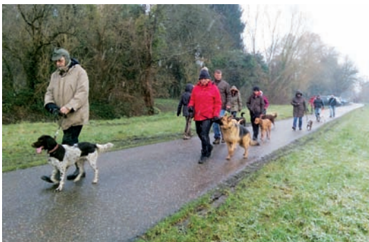
Beim gemeinsamen Spaziergang lernen die Hunde voneinander.