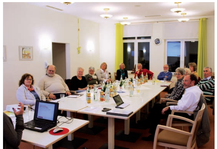
Teilnehmer der Schulung im Haus Edelberg

Internet: www.buergergenossenschaft-weingarten.de