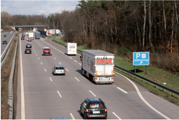
Der Parkplatz Höfenschlag markiert das nördliche Ende des Bauwerks, an dem im Falle, dass gebaut wird, begonnen werden soll.