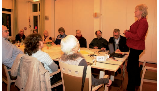
15 Teilnehmer nehmen an der Schulungsreihe für bürgerschaftlich Engagierte teil

Schammert ergänzte an dieser Stelle, dass derzeit eine Umfrage unter den Mitgliedern laufe, mit dem Ziel, Angebot und Nachfrage noch passgenauer zu ermitteln. Immer wieder hakten die Teilnehmer ein und berichteten von Erfahrungen aus ihren Einsätzen. Als ein Beispiel wurde der Wunsch einer betreuten Person nach einer gemeinsamen Mahlzeit genannt. Diesem sollte entsprochen werden, denn gemeinsames Essen sei eine besonders wertschätzende Form von Gemeinsamkeit. „Es geht darum, ein Gespür zu haben, was in dieser Situation gut tut“, bestätigte die Moderatorin. Zum Schluss wies sie auf die neuen Pflegeleistungsgesetze der Bundesregierung hin, nach denen betreute Personen einen Anspruch auf zusätzliche Leistungen haben. Der Verein „Bürger helfen Bürgern“ e.V. brauche, um solche Hilfe anbieten zu können, allerdings eine Zulassung durch entsprechende Qualifikation, wofür dieser Kurs bereits eine Basis sei. Nähere Informationen unter www.buergergenossenschaft-weingarten.de oder unter (07244) 558960. Eine Informationsbroschüre des Vereins ist im Bürgerbüro erhältlich.