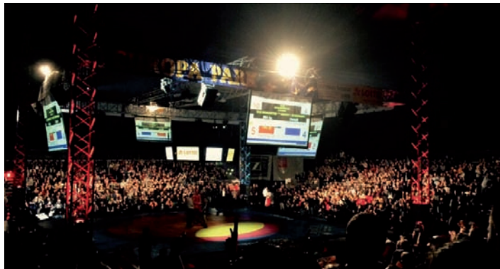
Halbfinale vor gigantischer Kulisse in Weingarten