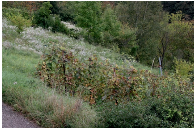
Zunehmend mehr verwahrloste Weinberge machen den verbleibenden Winzern zu schaffen.