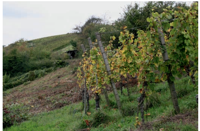
Immer mehr gerodete Flächen deuten auf einen Wandel im Rebbau am Petersberg hin.