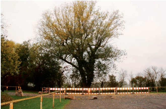
Die mächtige alte Weide bei der Kleiberitstraße muss aufgrund der Verkehrssicherungspflicht entfernt werden

Im Bereich zwischen Bahnübergang Kärcher und der Kleiberitstraße wurde ein neuer Parkplatz angelegt.