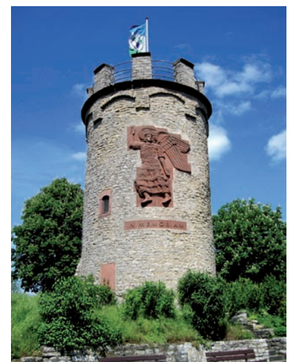
Das Museum im Turm des Bürger- und Heimatvereins hat an Allerheiligen letztmals geöffnet und bleibt bis Ostern 2016 geschlossen.

Im Gegensatz zum Turm ist das Heimatmuseum in der Durlacher Straße 30 über die Winterzeit an Sonn- und Feiertagen