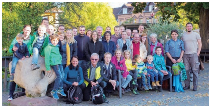
Ausflug mit dem TTC

Weitere schöne Fotos werden in Kürze auf unserer Homepage zu sehen sein. www.ttc-weingarten-baden.de