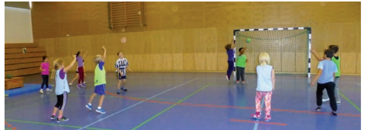
Schüler der 2. Klassen beim Handballspiel

Nach zwei Stunden lebhaftem Treiben in der Walzbachhalle konnten die Verantwortlichen auf eine erfolgreiche Aktion zurück blicken.