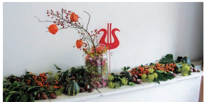
GV Frohsinn: Herbstliche Dekoration

TBR auch als e-paper erhältlich! Infos unter www.turmberggrundschau.de