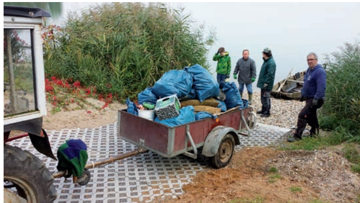
Seeputzete Herbst 2015

sein der betreffenden Seebesucher bessert und so die nächste Seeputzete im Frühjahr ein „schlechtes“ Ergebnis bringt.