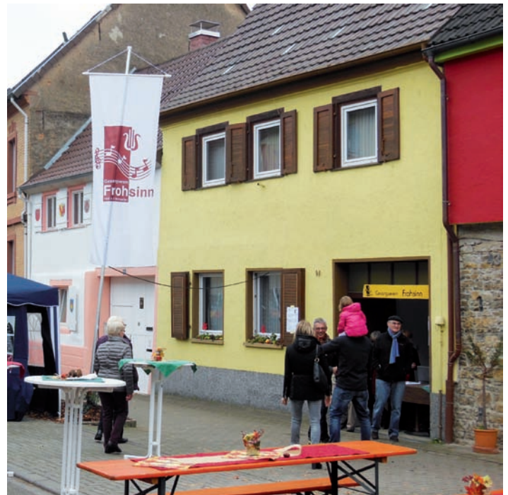
GV Frohsinn: Verkaufsoffener Sonntag

In einem herbstlich dekorierten Anwesen in der Bahnhofstraße servierte der Gesangverein Frohsinn verschiedene Gerichte und Getränke. Obwohl der Tag recht kalt war, kamen viele Gäste, die sich zur Mittagszeit über die wärmende Sonne freuten. Der Vereinsvorstand dankt allen Gästen und dem Gastgeber sowie den Organisatoren und Helfern, die gemeinsam einen schönen Sonntagnachmittag für alle Besucher gestalteten. hjmi