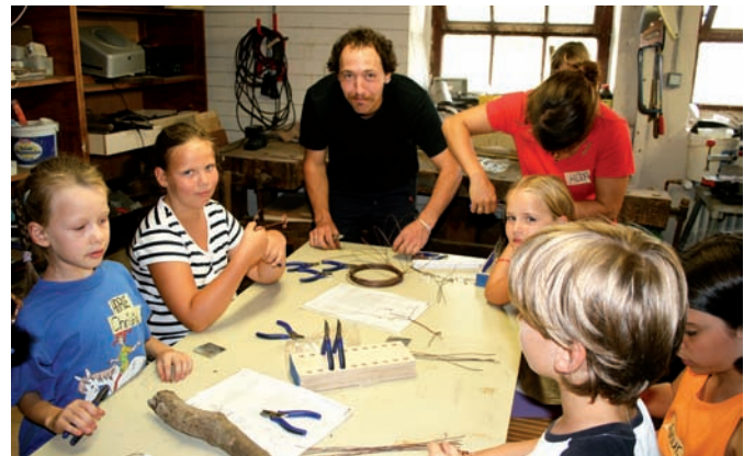
In der Werkstatt des Bürger- und Heimatvereins konnten die Ferienspaß-Kinder aus Kupferdraht Fingerringe und Armreife basteln.