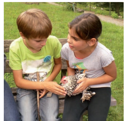
Tiere zum anfassen beim oberen Vogelpark.

Ferienstpaß beim oberen Vogelpark Bericht siehe bei Ferienstpaßberichten.