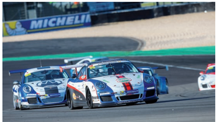
Bertram Hornung mit starken Rennen vor 40.000 Zuschauern

Eine atemraubende Atmosphäre bot sich den Fahrern des Porsche Super Sports Cup, der im Rahmenprogramm der FIA WEC (World Endurance Championship) gastierte. Vor 40.000 Zuschauern und bei bestem Wetter wurde auf dem Grand Prix Kurs zwei Einlaufsrennen bestritten.