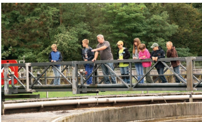
Eine Fahrt auf der Kontrollbrücke über dem Belebungsbecken ist für die Ferienspaßkinder fast so aufregend wie Karussellfahrten