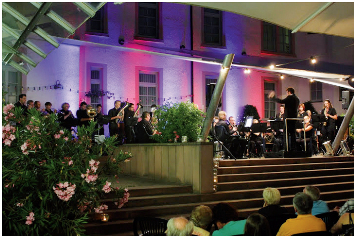
Wir laden herzlich ein zum Sommernachtskonzert am 05.09. um 19:30 Uhr...