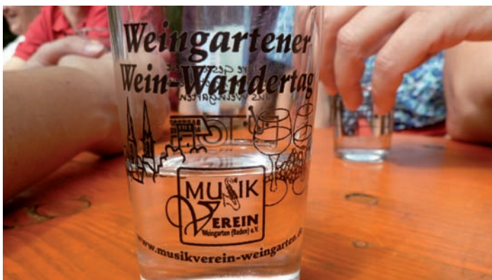
... und zum Weinwandertag am 06.09. ab 10:30 Uhr