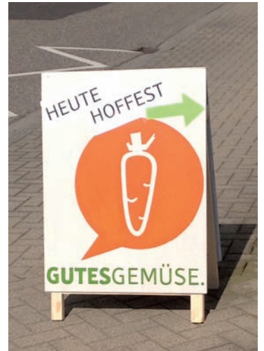
Am 3. Oktober ist es wieder soweit: die neue Gemüse-Saison beginnt mit einem Hoffest.