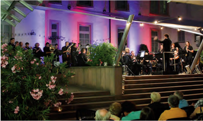
Eindrücke aus dem Sommernachtskonzert 2014

Konzertbeginn ist 19:30 Uhr, wir laden Sie herzlich ein, sich bereits ab 18 Uhr mit erfrischenden Getränken und kulinarischen Kleinigkeiten auf den Abend einzustimmen. Bitte denken Sie an wetterangepasste Kleidung und (wenn gewünscht) Sitzkissen. Ausweichtermin und -ort stehen leider nicht zur Verfügung. Wir freuen uns auf Sie! - Ihr Musikverein Weingarten.