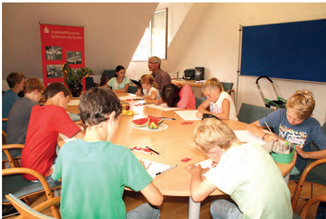
Spaß am Zeichnen hatten elf Kinder mit dem Ferienstpaß der Jugendstiftung der Sparkasse Karlsruhe