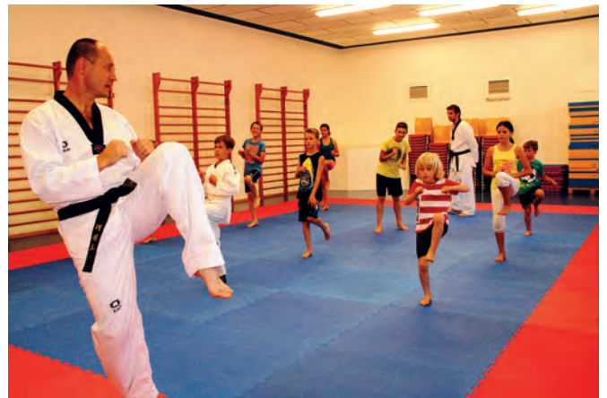
Dehnübungen sind unverzichtbar für ein Training, bei dem es unter anderem auch auf Beweglichkeit ankommt