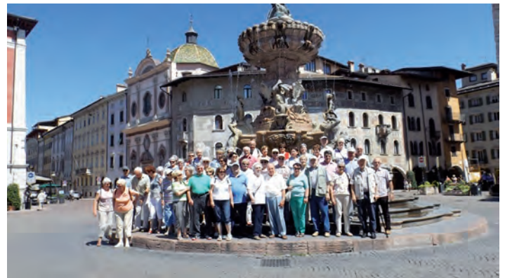
Reisegruppe auf dem Domplatz

Die Heimreise war am Donnerstag vorgesehen. Auch an diesem Tag - wie an allen Tagen davor - hatten wir Super-Sommerwetter! Wir fuhren mit dem Bus nach Tirano. Von dort erlebten wir eine sehr schöne Bahnfahrt mit dem Bernina-Express nach St. Moritz. Der Zug überwindet den Berninapass (2253m) und führt durch eine beeindruckende Gebirgslandschaft. Die Rückfahrt erfolgte am Nachmittag mit dem Bus über den Julierpass - Chur - entlang dem Zürichsee - Zürich - Basel. Bei der Raststätte Breisgau konnten wir uns den Nachmittagskaffee gönnen, sodann die Heimreise nach Hause fortsetzen. Die Reisegesellschaft kam dann --nach einem schönen, erlebnisreichen Ausflug -gegen 22 Uhr in Weingarten an. OB