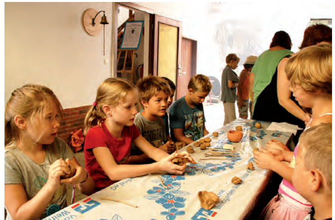
Auch die Steinzeitmenschen verwendeten Gefäße aus Keramik, darum war Töpfern ein Programmpunkt beim Ferienspaß „Ausflug in die Steinzeit“