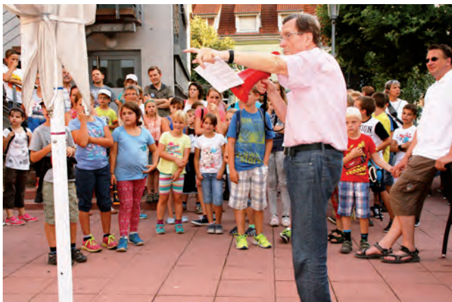
Jahr für Jahr ist die Nachtwanderung der Renner im Ferienspaßprogramm. 80 Kinder starteten am Rathausplatz unter Aufsicht von mehreren Wanderführern und -führerinnen.