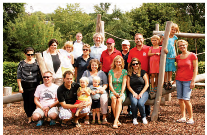
„Wasser intensiv“ machte den acht Jungs und Mädels richtig Spaß