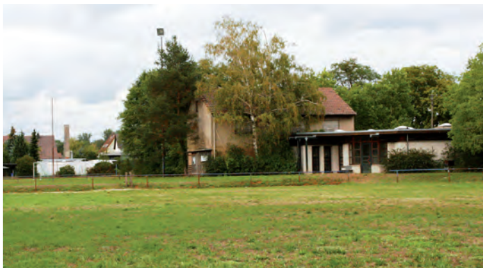
Alter Sportplatz des TSV, im Hintergrund die Clubgaststätte „TSV-Pavillon“

Eine mündliche Information des Bürgermeisters zum Sachstand in Sachen Flüchtlingsunterbringung solle, solange das Thema aktuell sei, ab sofort in Zukunft Usus zu Beginn einer jeden Gemeinderatsitzung werden, erklärte Bürgermeister Eric Bänziger den Räten zu Beginn der jüngsten Sitzung. Es sei weiterhin mit erheblich steigenden Zahlen zu rechnen, bis 2018 müsse Weingarten nach heutigen Erkenntnissen für 400 Personen sorgen und Unterkünfte schaffen. Für die Errichtung einer Gemeinschaftsunterkunft mit mobilen Wohneinheiten durch das Landratsamt sollte die Gemeinde Grundstücke zur Verfügung stellen und hat dafür mehrere ausgewählt (wie berichtet). Das am schnellsten verfügbare und taugliche war ein Flurstück im Gewann „Winkelpfad“, das im Geltungsbereich eines Bebauungsplans liegt.