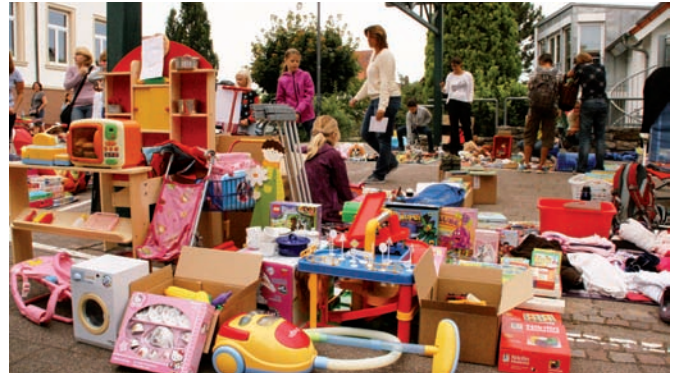
Spielzeug aller Arten war in Hülle und Fülle beim Flohmarkt „Von Kind zu Kind“ zu finden

zwar gut erhaltenen aber sichtbar gern benutzten Spielsachen waren auch Dinge zu finden, die noch ganz neu waren: Geschenke, die vielleicht doch nicht hundertprozentig das Richtige waren.