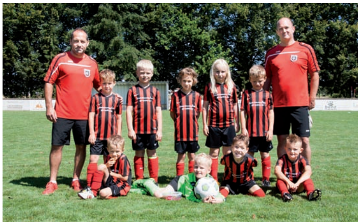
Unsere F3 in Friedrichstal

Bei besten Bedingungen und strahlend blauem Himmel am letzten Juli Wochenende stand das finale Turnier der F 3 ler in Friedrichstal an.