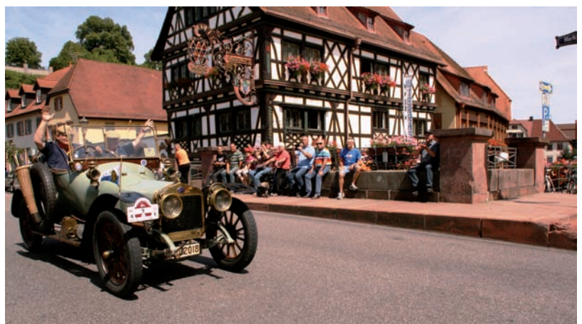
Mit deutlich über einstündiger Verspätung rollten die ersten Fahrzeuge ein. Trotzdem waren die Zuschauer begeistert und winkten den Fahrern zu.

es nicht um Geschwindigkeit, sondern sie gilt als „Zuverlässigkeitsfahrt“, Ziel ist unbeschadet in Pforzheim anzukommen, was für diese top gepflegten Oldtimer aber aufgrund ihres Alters schon eine Leistung ist: Das älteste Automobil unter den Teilnehmern war ein Benz Viktoria Vis-Vis Baujahr 1893, das jüngste ein Büssing 4000 TS Baujahr 1955.