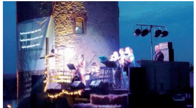
Die Gruppe „Unique“ gestaltete die erste worshipnight open air am Wartturm

Abends zu empfangen. Nach ihren Beweggründen für diesen Abend befragt, berichteten die drei jungen Frauen, sie wollten in einem gemeinschaftlichen Erlebnis Gott loben. Es sollte keine Show sein, sondern ein gemeinsames spirituelles Erlebnis. Weiche, harmonische und nachdenklich machende Melodien wechselten mit satten kräftigen Rockstücken, die auch zum Mitklatschen einluden. Mehr und mehr Zuhörer fanden sich ein, aber nicht alle suchten Nähe. Einige blieben in räumlicher Distanz und waren nicht zu völliger Identifikation bereit waren, aber dennoch fasziniert. Gleichgültig welcher Couleur, die Musik und die Stimmung dieser Location verfehlten ihre Wirkung nicht.