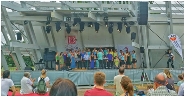
Die Swinging Voices beim Stadtgeburtstag

Es wird darum gebeten, die Abfahrtszeiten unbedingt einzuhalten.