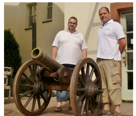
Mit 3 Salutschüssen wurde das Wein- und Straßenfest eröffnet.