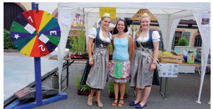
Schönheiten an unserem Stand auf dem Wein- und Straßenfest

Ob die Wein-Königin und die Prinzessin bei uns eine Waffel gegessen haben ist nicht überliefert. Sie haben aber wie viele andere