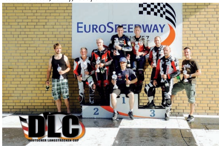
Nach einem ereignisreichen Rennen schafften es unsere MSC'ler dennoch auf das Podium