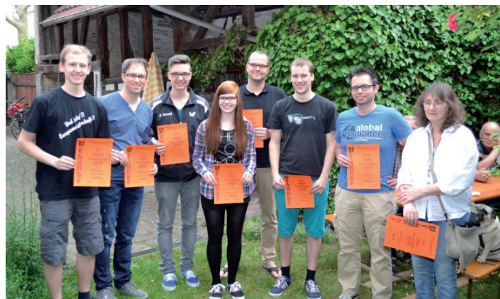
Die Siegerinnen und Sieger im Doppel

Einladung zur Vereinsmeisterschaft der Mädchen und Jungen Hallo Mädchen und hallo Jungen, die diesjährigen VM müssen wir aus Platzgründen getrennt durchführen. Wir beginnen am Freitag, dem 19.06.2015 in der Mineralix Arena mit den B-Schülern .