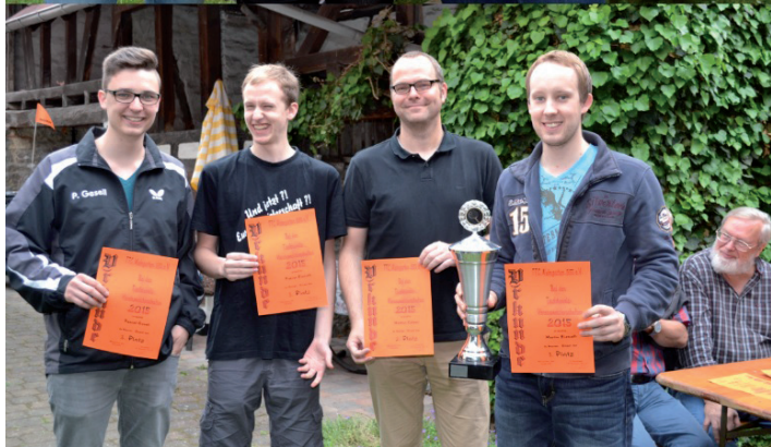
Die Siegerinnen und Sieger im Einzel