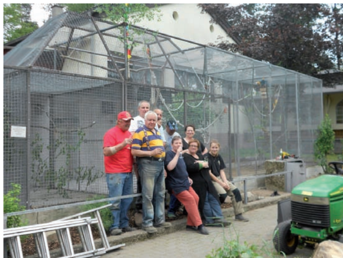
Unsere neue Aravoliere

Unsere neue Aravoliere ist fertig ! Nun haben unsere Aras mehr Platz zum fliegen. In den nächsten Tagen wird der Mitgliederbeitrag für das Jahr 2015 eingezogen. Der Beitrag der im Januar eingezogen wurde, war für das Jahr 2014. Das Vogelpark-Team