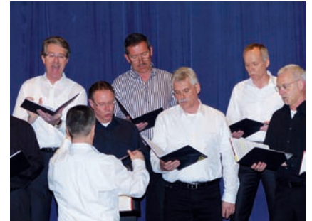
Men in Mood