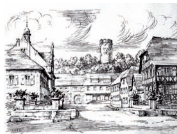
Der Weingartener Marktplatz in einer typischen Federzeichnung von Erwin Koch mit den ehemaligen Gasthäusern „Lamm“ (links) und „Adler“ mit Gesindehaus (rechts).

Der Bürger- und Heimatverein besitzt einige seiner Werke. Klaus Koch hat dem Verein dankenswerter Weise die so genannte Kniehebelpresse seines Vaters überlassen. Sie wurde inzwischen im Heimatmuseum aufgebaut und kann für Druckvorführungen genutzt werden. Der Druckfachmann Klaus Gerbing hat dafür einen Druckstock mit Bleileitern in der Gutenbergstube des Heimatvereins Blankenloch-Büchig hergestellt, mit dem parallel zur Ausstellung die Kunst des Buchdrucks anschaulich demonstriert werden kann.