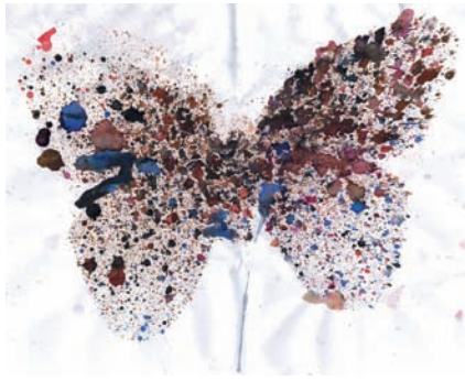
Schmetterling in Spritztechnik

Der zweite Teil des Projektes bestand in einer Einladung ins Bürger- und Heimatmuseum, wo verschiedene Stationen aufgebaut waren. Begonnen wurde der Besuch, in dem die Geschichte des Schmetterlings vorgespielt wurde und auch gefragt wurde, was Schmetterling und Huhn gemeinsam