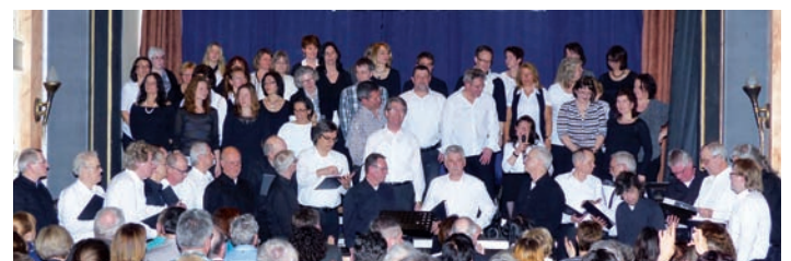
Beide Chöre zusammen auf der Bühne