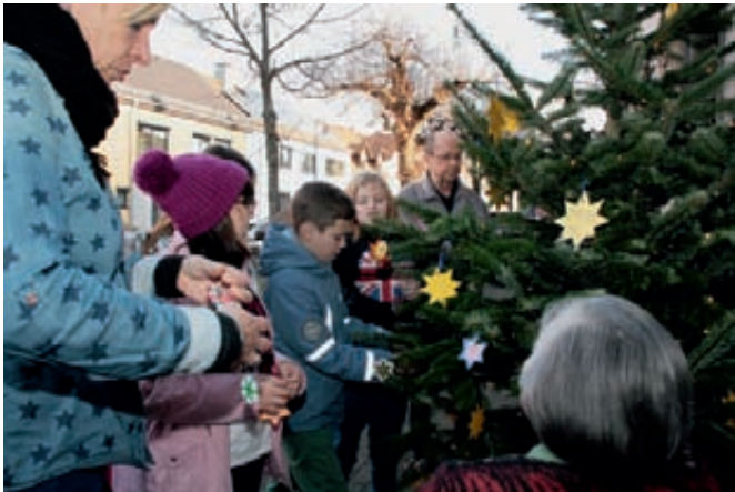
Schülerinnen und Schüler der Gemeinschaftsschule schmücken gemeinsam mit Senioren aus Haus Gartenblick den Weihnachtsbaum vor deren Tür.

Nun ging es ans Schmücken. Auch das Haus Gartenblick hat einen Baum aus der Weihnachtsaktion des Gewerbevereins vor die Haustür gestellt und in gemeinsamer Aktion wurden die bunten Anhängerchen an den Zweigen verteilt.