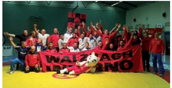
Der SVG und das Inferno beim KAV Mansfelder Land