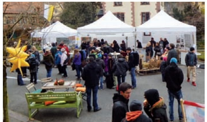
Unser gut besuchter Stand

Umrahmt von den verschiedenen musikalischen Beiträgen der Weingartner Musikgruppen und vielen guten Gesprächen mit „Stammkunden“ und neuen Käufern verging der Nachmittag wie im Flug, und zur Adventsstimmung fehlte, wenn überhaupt, nur der Schnee. Besonderer Dank gebührt wie immer unserem bewährten Sponsor von Fahrzeug und technischem Equipment und in diesem Jahr auch der Bäckerei Scherk in Untergrombach für das Bereitstellen ihrer Backstube und die nette Anleitung unserer Jungbäcker!