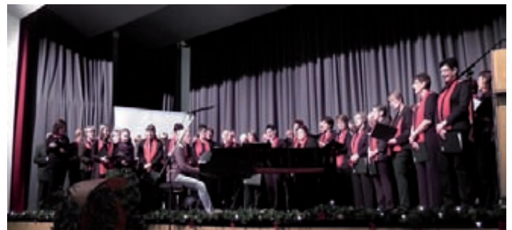
Weihnachtsfeier des GV Frohsinn

Live-Kultur statt TV: Zahlreiche Besucher folgten der Einladung des Gesangvereins Frohsinn Weingarten in die Walzbachhalle zur diesjährigen Weihnachtsfeier. In der ersten Hälfte des Programms stand der Gesang im Vordergrund, den zweiten Teil gestaltete die vereinseigene Theatergruppe. Auch die traditionelle Tombola durfte nicht fehlen.