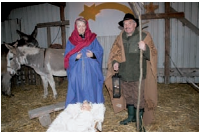
So könnte es gewesen sein: Maria und Josef mit Kind und Esel im Stall