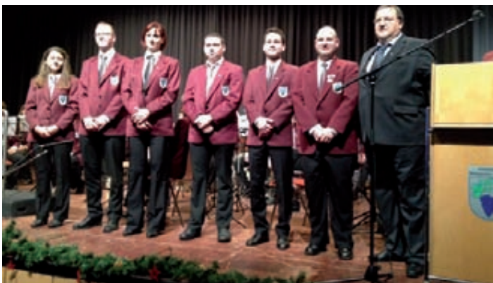
Verleihung der Verbandsehrennadeln