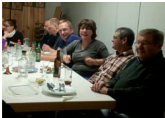
Wo bleibt die nächste Portion Käse?