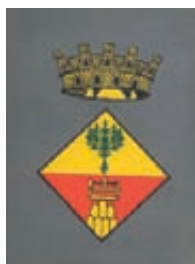
Olesa de Montserrat

Mittwoch, 31.12.2014 18:00 Gottesdienst zum Jahresabschluss