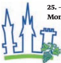
Gemeinde Weingarten (Baden)

25. - 27. September 2015: Gäste aus Olesa de Montserrat / Spanien in Weingarten