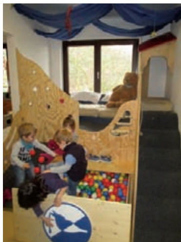
Eroberung der Süieebene

Sichtlich mit viel Begeisterung erobern die Kinder der „Puzzli“-Gruppe in der Kita BLAULAND zurzeit ihre neue zweite Spielebene. Rampe, Ausguck, Kuschelecke und Bällebad, das alles wurde in sehr gelungener Art und Weise in die vom Erzieherinnen-Team geplante und vom Hausmeister gebaute Spielanlage integriert. Das Kleiberit-Logo, in Form eines Kleibers weist dabei auf den Sponsor hin: Die in Weingarten ansässige Firma Klebchemie hat mit einer kräftigen Finanzspritze das Projekt ermöglicht. Das Allerdings-Familienzentrum (Träger der Einrichtung) bedankt sich herzlich bei der Firma Klebchemie für die Unterstützung.