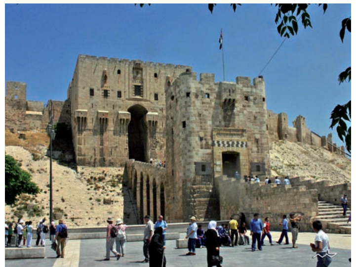
Zitadelle von Aleppo

Wenn Ihr Interesse geweckt ist, dann kommen Sie zum Bildvortrag bei unserem Frauenfrühstück am Mittwoch, 19. November um 9:00 Uhr ins katholische Gemeindezentrum, Schillerstraße 4.