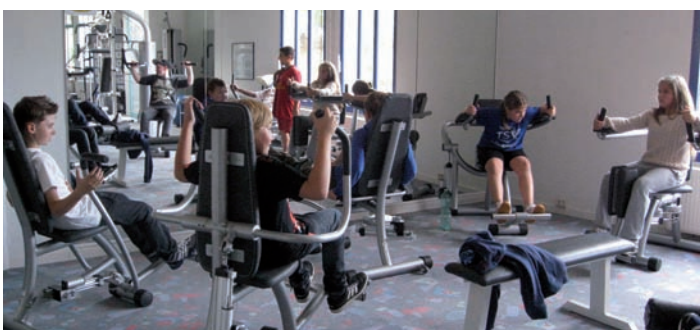
Gerätetraining im Lavit in Blankenloch