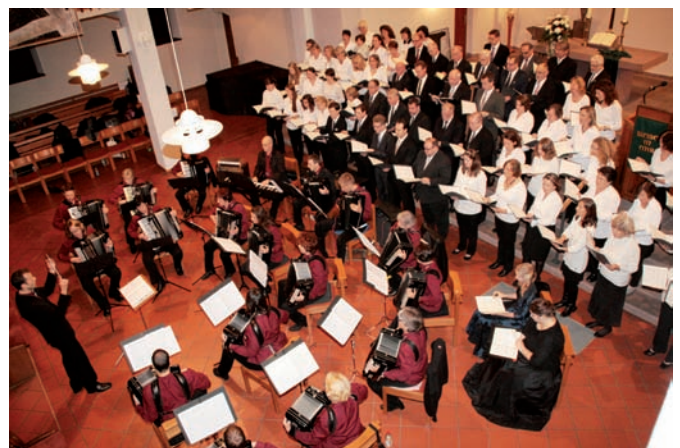
Das Akkordeonorchester Weingarten und der TMG-Chor Stutensee konzertierten zum ersten Mal gemeinsam