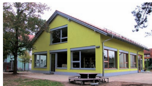
Neubau und Sanierung des Kindergartens Waldbrücke sind abgeschlossen