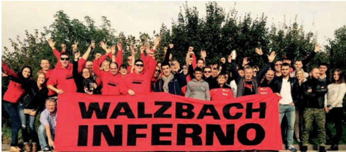
Auswärtsfahrt nach Aalen mit Mannschaft und Fans