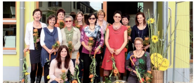
Das Team des Kindergartens Waldbrücke