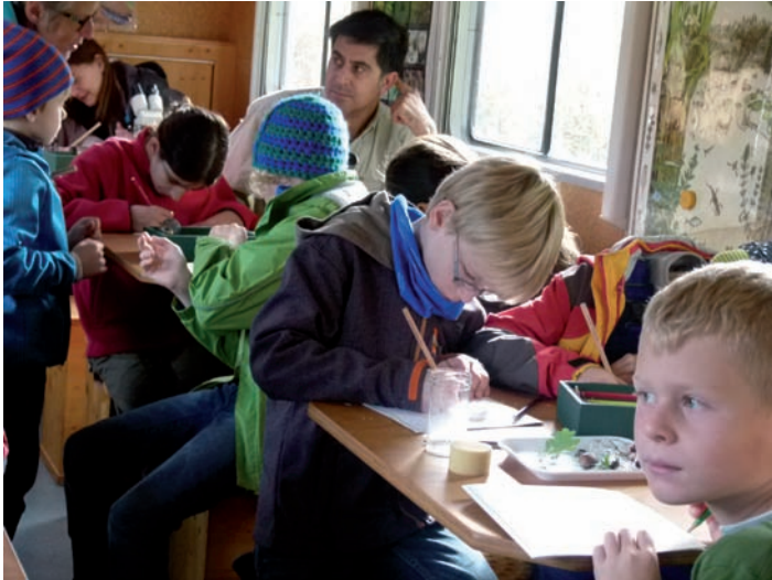
Bei der Forscherarbeit