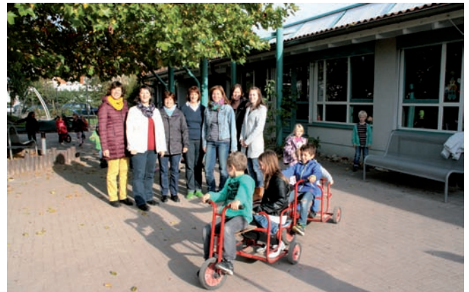
Das Team des Kindergartens St. Franziskus im Stammhaus in der Kanalstraße