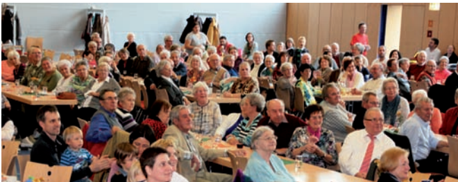
Zahlreiche Gäste verfolgten das abwechslungsreiche Programm

Es ist lange Tradition, dass Vereine, die ein Jubiläum feiern, in diesem Jahr den Seniorenachmittag der Gemeinde ausrichten. Somit war in diesem Jahr der Skiclub Stabil anlässlich seines 25. Geburtstags an der Reihe und hatte ein wahrhaft ansprechendes und wirklich kurzweiliges Programm zusammengetragen.