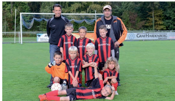
Unsere F2 am 22.09. in Leopoldshafen