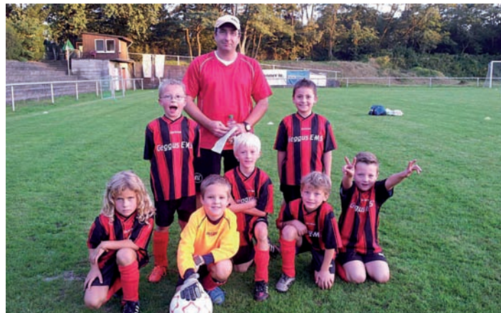
F2 am 27.09. beim SV Karlsruhe