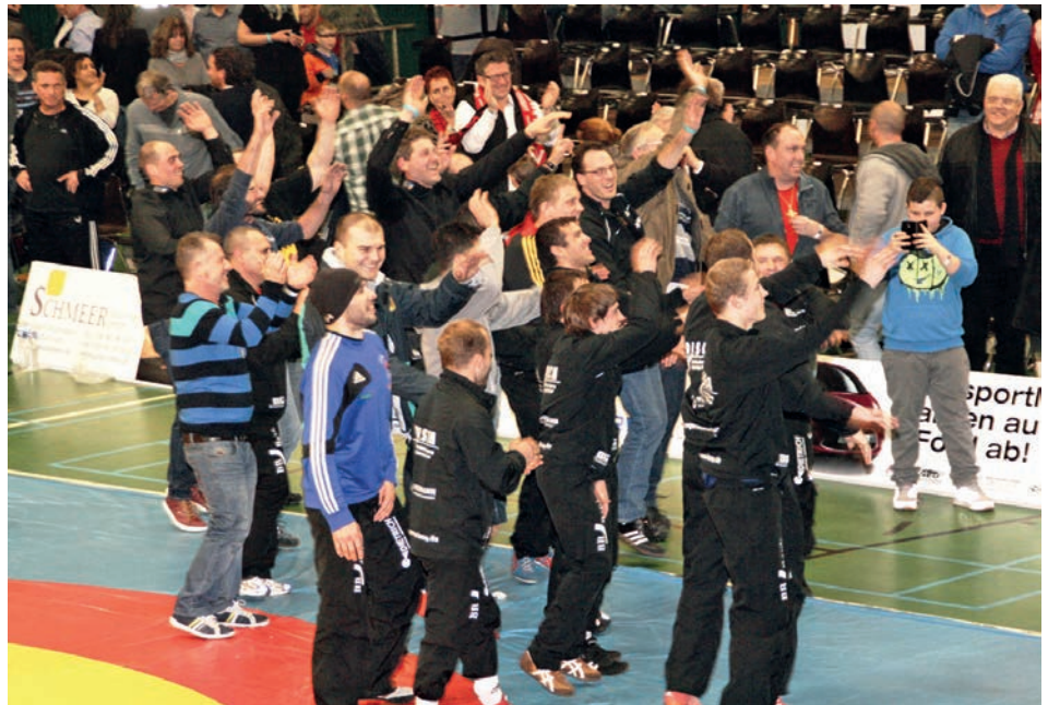
Die Mannschaft bedankte sich bei den Fans für die Unterstützung