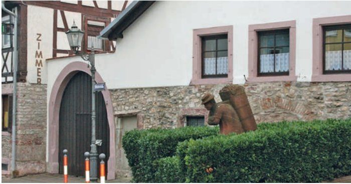
Der Buttenträger an der B 3