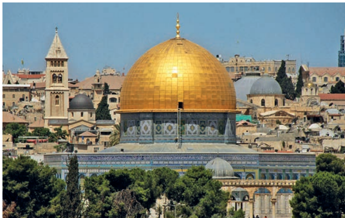
Der Felsendom mit Erlöserkirche und Grabeskirche

Wie aber leben die Menschen heute in Jerusalem? Wie erleben und