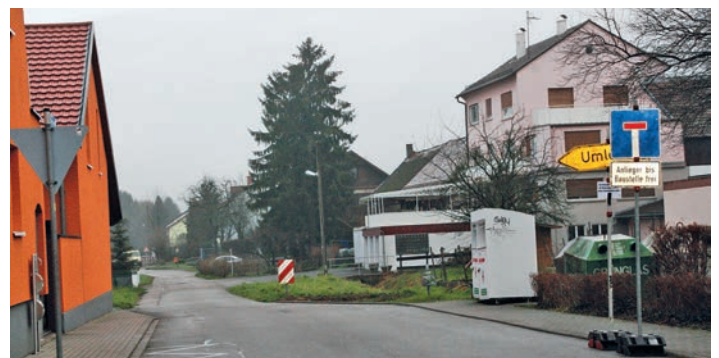
Sperrung des Breitwiesenwegs bis Ende Februar

Bis voraussichtlich Ende Februar wird nach Auskunft der Leiterin der örtlichen Straßenverkehrsbehörde, Ulrike Gaum, der Breitwiesenweg wegen Kabelarbeiten noch gesperrt sein. Ein zusätzliches Schild weist darauf hin, dass ein Befahren nur bis zum Haus Nr. 29 möglich sei, eine Umleitung führt über die Höhefeldstraße.