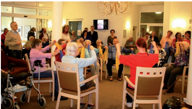
Mit einem rhythmischen Sitztanz, unterstützt durch bunte Tücher, zeigten die Seniorinnen und Senioren im Haus Edelberg, wie Musik inspiriert und was Freude und Farbe in den Alltag bringt