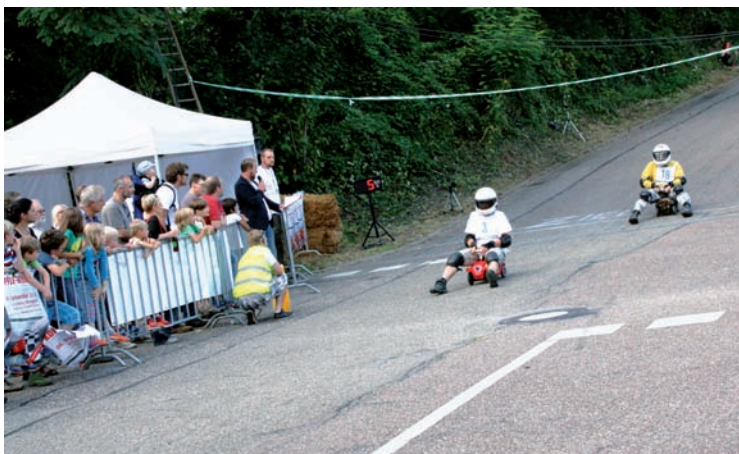
Rennatmosphäre am Katzenberg

Gefahren wird in vier Klassen: Bambinis, Amateure, Fun und Profis. Die „Fun“-Klasse ist in diesem Jahr nur mit zwei Fahrern besetzt, der Dritte muss aufgrund technischer Schwierigkeiten im letzten Moment seine Teilnahme zurückziehen. Vier Starter sind bei den Profis gemeldet. Die Strecke beginnt oben am Katzenberg, führt um eine steile Kurve, durch eine Schikane mit Strohbällen und endet nach 300 Metern am Ziel in einer aufblasbaren Hüpfburg, in die sich der eine oder andere Fahrer mit Schwung hineinkatapultiert. Zahlreiche Zuschauer säumen den Zieleinlauf und feuern die Fahrer an. In der Profi-Klasse darf mit getunten Fahrzeugen gestartet werden. Hier ist zu sehen, was echte Freaks alles möglich machen: Verlängerte Lenkräder, Gewichte an den Achsen, breitere Sitze und mehr. Aber ein Regelwerk bestimmt, was geht und was nicht, denn schließlich geht es nicht nur um Gewinnen, sondern auch um Spaß und nicht zuletzt um Sicherheit.