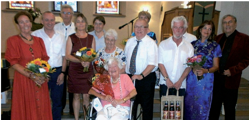
Am Ende des Liedernachmittags vereinigten sich alle Mitwirkenden zu einem Ensemble und sangen gemeinsam das Volkslied „Wenn ich ein Vöglein wär“.