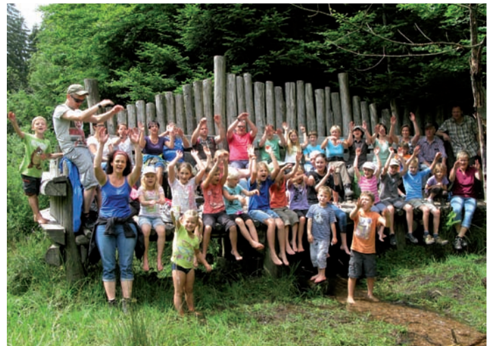
Im Wilderlebnispfad am Plättig