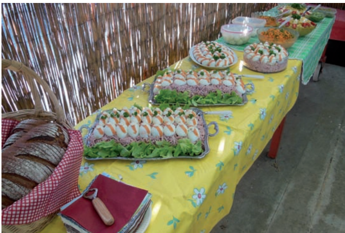
Das köstliche Buffet, vielen Dank an Gerda!