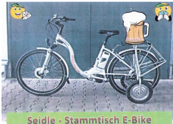
Seidle - Stammtisch E-Bike

Mittwoch, 13. August, 18.00 Uhr, Mineralix Arena, treffen sich Mitglieder, Nicht-Mitglieder und Freunde zum Radfahren. Wir fahren in Richtung Grötzinger Baggersee und durch das Weingartener Moor. Nach der Radtour bowlen wir noch in der Gärtnerklausur bei einem kühlen Trunk.