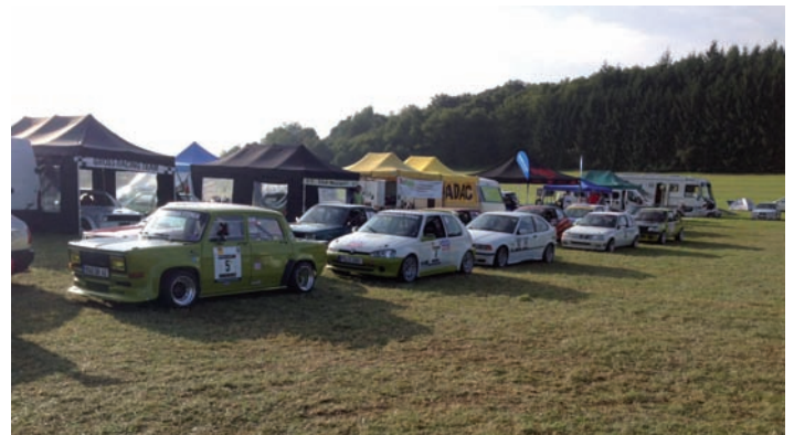
Der BMW von JP Racing im Vorstart