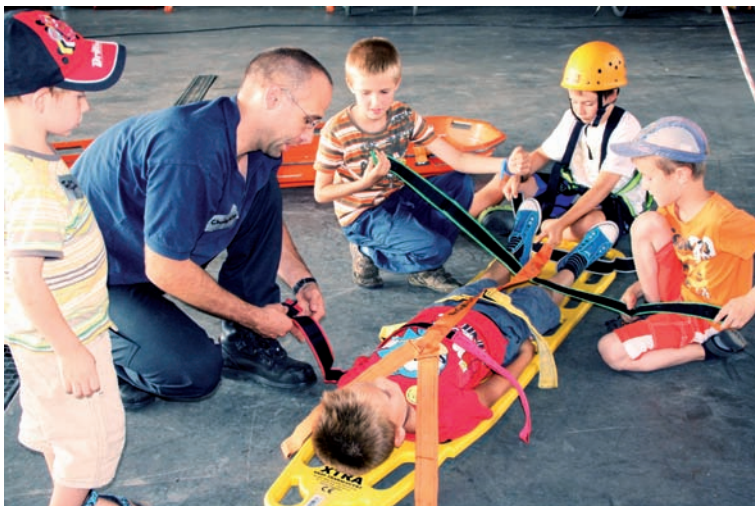
Ein Verletzter wird auf der Schaufeltrage zur Sicherheit noch festgurtet

der weiß, was zu tun ist. Im Mannschaftswagen ist es mitunter eng, vor allem wenn die Fahrt zum Brandort geht und die Atemschutzträger sich während der Fahrt ausrüsten müssen. Eine echte Einsatzjacke wiegt auf Kinderschultern richtig schwer und der acht Kilo schwere Rucksack mit der Druckluftflasche sowie die Atemschutzmaske kann man nur wenige Minuten aushalten. Dagegen ist es ein tolles Gefühl, sich in die Rettungstrage zu legen und über einen raffinierten Flaschenzug nach oben ziehen und wieder absenken zu lassen. Erstaunlich, wie kinderleicht selbst ein schweres Gewicht gezogen werden kann. Bei der Feuerwehr ist alles auf Sicherheit ausgerichtet. Wird ein Verletzter mit der Schaufeltrage geborgen und abtransportiert, so wird er mit einer Gurtspinne erst festgeschnallt. Alle Dinge sind mit Umsicht, Vorsicht und Weitsicht zu handhaben, damit nicht aus einer gut gemeinten, aber ungeschickt ausgeführten Aktion schlimme Folgen entstehen. Den insgesamt acht Betreuern war keine Frage zu viel, freundlich und geduldig ließen sie sich löchern. Dass Teamgeist, Verlässlichkeit und Kameradschaft ungeschrie-