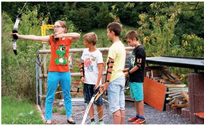
Hier versuchen sie sich am Bogenschießen. Einen Bogen zu spannen kostet mehr Kraft als zunächst gedacht.