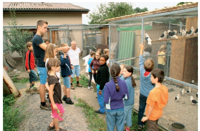
Der Ferienstpaß bei den Geflügel- und Kaninchenzüchtern ist jedes Jahr sehr gefragt