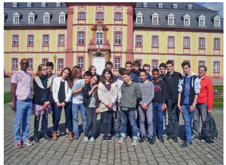
Jugendliche aus Frankreich zu Gast in Bruchsal

Neben dem Besuch des Unterrichts an einer deutschen Schule stand vor allem das Kennenlernen des Nachbarn im Vordergrund. Die Schüler wohnten bei den Familien ihrer Austauschpartner und erfuhren so viel über die Lebens- und Essgewohnheiten bei uns. Ausflüge in die nähere und weitere Umgebung ermöglichten ihnen ebenfalls Eindrücke in Kultur und Arbeiten des bedeutendsten französischen Nachbarn. Immer wieder begeistert das ZKM in Karlsruhe mit der Vielfalt der medialen Möglichkeiten in Kunst und Technik. Der Besuch des Porsche-Museums in Stuttgart gilt ohnehin bei den jungen Franzosen als der Höhepunkt der Ausflüge. Aber auch die Besichtigung des Bruchsaler Schlosses ist inzwischen zu einem beliebten Programmpunkt geworden. Bei der unverzichtbaren Abschlussparty wurden auch gegenseitige private Einladungen gemacht und der Abschied am nächsten Morgen fiel nicht allen leicht. K.H.