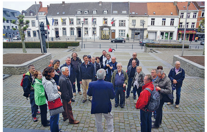
Vor dem Wellington-Museum

Nach 8-stündiger Fahrt erreichen wir froh und munter unser Hotel und beziehen die Zimmer.