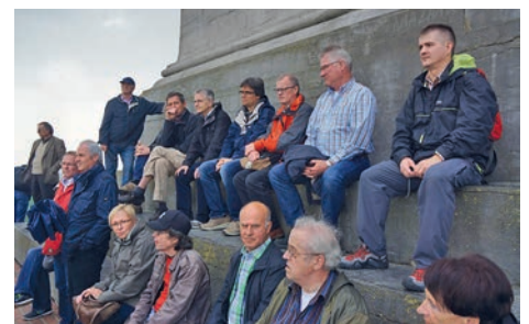
Auf dem Löwenhügel

Wir besuchen die Stadtkirche und das Wellington-Museum, danach Besteigen wir den Löwenhügel, ein künstlich aufgeschütteter 40 Meter hoher Hügel, mit einem herrlichen Blick über das Schlachtfeld. Hier haben die Truppen Napoleons die entscheidende Niederlage gegen britische und preußische Verbände hinnehmen müssen. Im Panorama, einer riesigen Rundwandmalerei mit Kampfszenen, finden wir uns mitten auf dem Schlachtfeld wieder. Danach haben wir noch Zeit, das Preußische Mahnmahl zu besichtigen. Dort erwarten uns bereits Mitglieder der Vokalgruppe Melting Vox, um uns mit kleinen Snacks und Aperitifs zu begrüßen. Den ersten Abend beenden wir mit einem ausgiebigen Buffet.