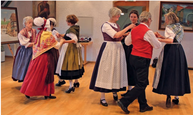
Die Volkstanzgruppe des Bürger- und Heimatvereins sowie des Karlsruher Volkstanzkreises umrahmte die Feier im Rathaus.

(bhv). Der Wettergott hat es am vergangenen Sonntag nicht gut gemeint mit dem Bürger- und Heimatverein. Als die freiwilligen Helfer am frühen Vormittag das Festzelt auf dem Turmberg für die Feier „25 Jahre Museum im Turm“ aufschlagen wollten, drohten Sturmböen, es wegzufegen. Deshalb wurde der Festakt nach vorsorglicher Absprache mit der Gemeinde in das Turmzimmer des Rathauses verlegt. Dort war es auch möglich, dass die Volkstanzgruppe des Bürger- und Heimatvereins sowie des Karlsruher Volkstanzkreises unter Leitung von Werner Wenzel der Feier mit ihren abwechslungsreichen Tänzen einen festlichen Rahmen gaben.