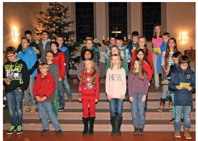
Bei der Probe in der Kirche

Rund zehn Minuten dauert ein Besuch, dann ziehen die Sternsinger weiter. Bevor sie gehen, bringen sie noch die Segenschrift am Türrahmen an: 20°C+M+B*14.