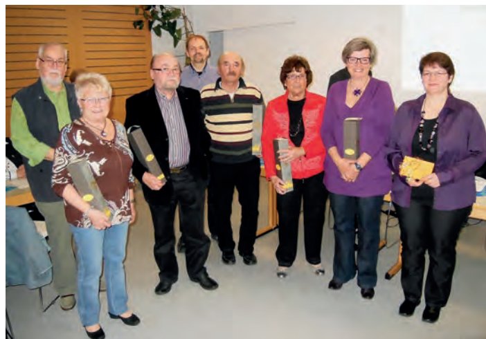
JHV Frohsinn - einige der „lückenlosen Probenbesucher“