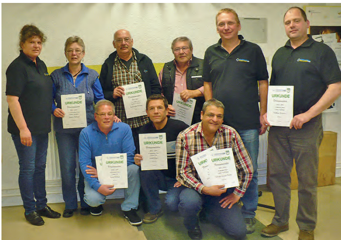
Vereinsmeister Kugeldisziplin 2014