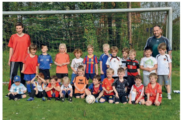
Unsere aktuellen Bambinis