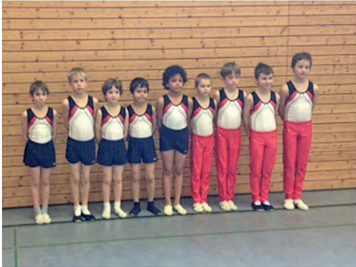
TSV Weingarten e.V. Abteilung: Volleyball www.tsv-weingarten.de