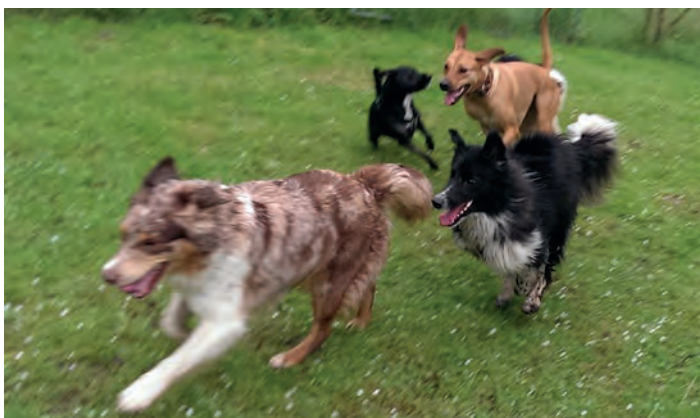
Auch das wilde Spiel gehört dazu!