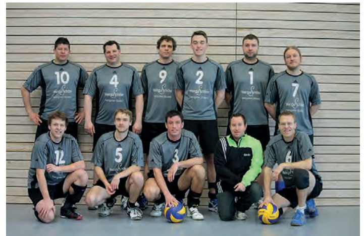
Herrenmannschaft Saison 13/14