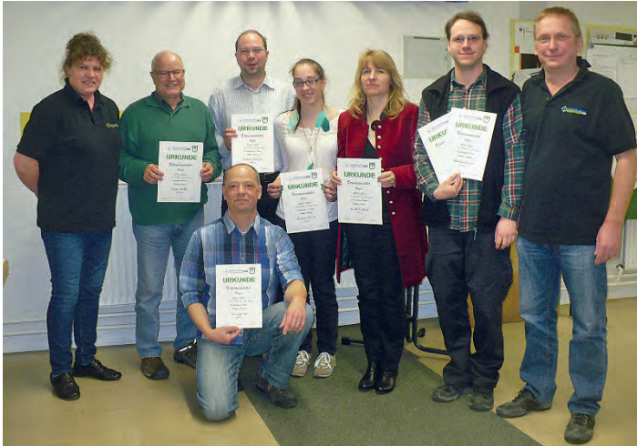
Vereinsmeister Bogen 2014