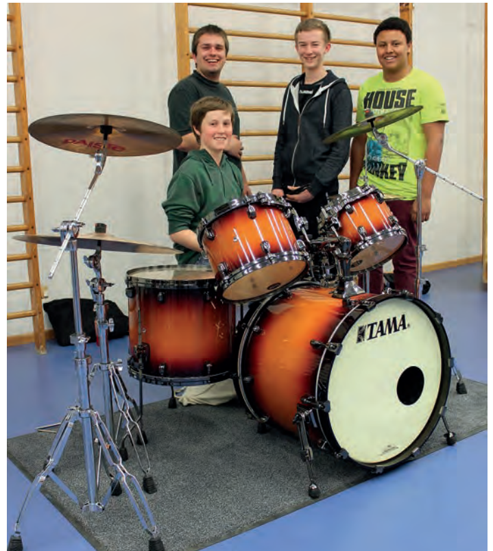
Dank der Unterstützung der Firma Klebchemie: Strahlende Gesichter bei den Schlagzeugern

Für den Musikverein mit einem Orchester der Oberstufe ist eine hohe Qualität der Ausstattung ausschlaggebend. So tragen verein-