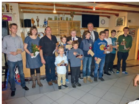
Die Jugendabteilung des MSC Weingarten war auch 2013 wieder ein Garant für Erfolge

Auch der Nachwuchs im MSC Weingarten wurde am vergangenen Samstag geehrt. Die Jugendmannschaft kann im ADAC Kartslalom auf ein erfolgreiches Jahr zurück blicken. Mit zahlreichen Pokalrängen erhielten mehrere Fahrer sogar die Chance bei überregionalen Meisterschaftsendläufen anzutreten.