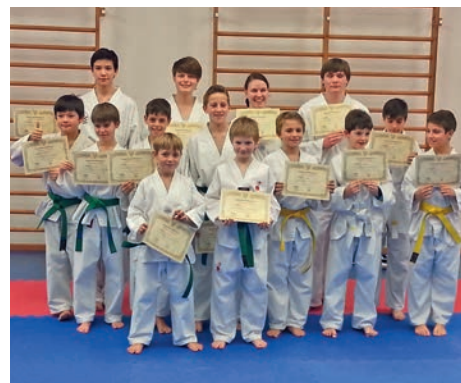
Gruppe vom 05.12.2013

Am 4. und 5. Dezember fanden beim Taekwondo Club Weingarten Gürtelprüfungen statt. Insgesamt 18 Prüflinge nutzen die Gelegenheit noch dieses Jahr den nächsten Kup zu erreichen. Wie üblich bei Taekwondo-Prüfungen wurde mit Grundschule bzw. der UANberprüfung des Vorprogramms begonnen. Trainer und Prüfer nutzte diesen Teil auch gleich um das Prüfungsfach Theorie zu überprüfen, indem er verschiedene Taekwondo-Techniken oder -Stellungen sehen wollte und dabei auch auf einige Fehler hinwies. Danach kamen die Formen (taeguek) an die Reihe. Beim Kampf gegen imaginäre Gegner konnte man die Nervosität einiger Prüflinge deutlich sehen. Nun standen die Partnerübungen Ein-Schritt-Kampf (ilbo-taeryon) und Verteidigung gegen Haltegriffe (hosinsul) auf dem Programm. Danach hieß es Kampfweste und Schutzausrüstung anlegen. Die Prüflinge sollten verschiedene Standardtechniken auf die Weste des Partners demonstrieren und im Anschluss folgte ein Freikampf nach dem Regelwerk, wie es bei olympischen Spielen angewandt wird. Für einige Prüflinge war die Prüfung damit beendet, andere, die den blauen oder einen höheren Gürtel anstreben, mussten sich noch im Bruchtest beweisen. Bei diesem Prüfungsfach soll die korrekte Technik überprüft werden. Leider brachen nicht alle Bretter, aber am Ende erreichten alle Prüflinge ihr Prüfungsziel. Herzlichen Glückwunsch.