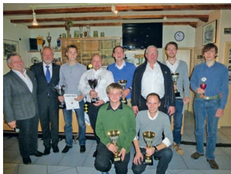
Die Erfolge gehen weiter... mit der Slalom-Gruppe ermöglicht der MSC den direkten Umstieg vom Kart auf das Auto

Auch der Nachwuchs im MSC Weingarten wurde am vergangenen Samstag geehrt. Die Jugendmannschaft kann im ADAC Kartslalom auf ein erfolgreiches Jahr zurück blicken. Mit zahlreichen Pokalrängen erhielten mehrere Fahrer sogar die Chance bei überregionalen Meisterschaftsendläufen anzutreten.