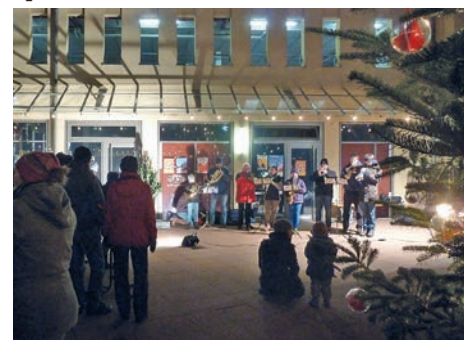
Adventszauber auf dem Rathausplatz.

Am Nikolaustag trotzten viele Gäste dem eisigen Wind und stimmten sich mit Blasmusik und Glühwein auf die Weihnachtszeit ein. Danke allen Mitspielern, Helfern und der Jugendfeuerwehr, die uns mit Speis und Trank verwöhnt haben.