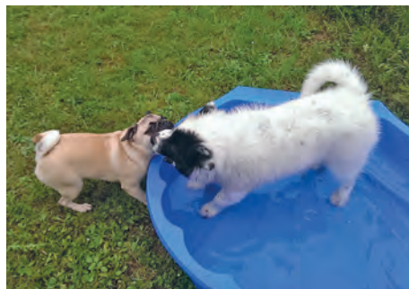
Da haben sich zwei wieder gefunden