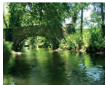
Auf der Pfingz bei Hagsfeld

Vielleicht klappt es beim dritten Anlauf!