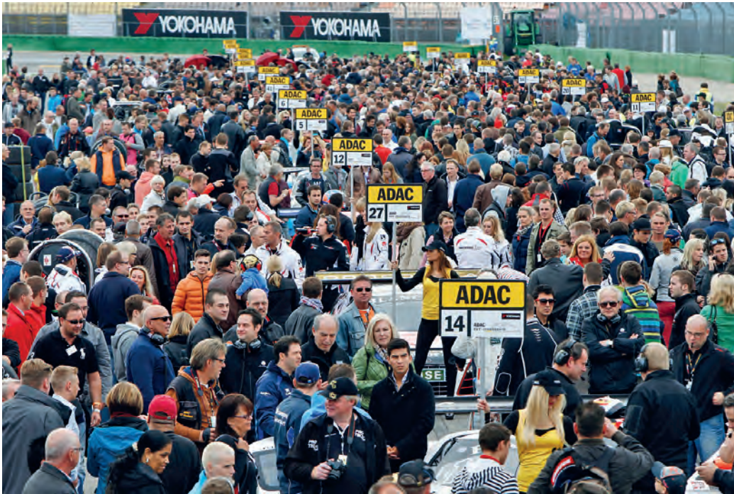
Hier war mehr los als bei der DTM oder Formel 1. Kein Wunder, beim „Großen Preis von Weingarten“ erleben die Zuschauer Motorsport noch hautnah!