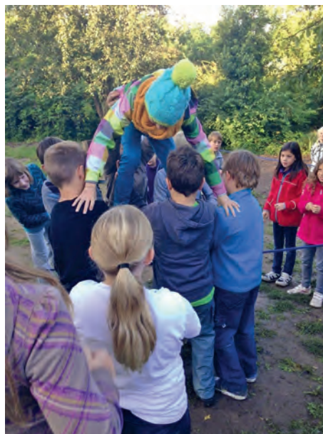
Ziel der ersten Wochen in der neuen Schule: eine Gemeinschaft werden

Die 5a machte diesen September den Start und zog bei bestem Herbstwetter los, um zwei ganze Vormittage lang gemeinsam zu „arbeiten“. Schnell wurde allen bei diversen Klassenaktionen unter fachmännischer Leitung klar, dass man nur zusammen ans Ziel gerät.