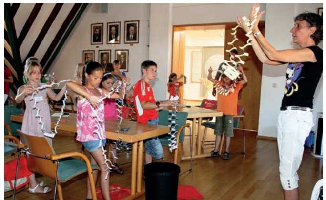
Ein normales Blatt Papier verwandelt sich in einen Ring, so groß, dass Kinder durchsteigen können - ist das nicht Zauberei?

Fasziniert folgten ihr die Kinder, gefesselt von dem, was sie sahen und beseelt von dem Gedanken, das bald selbst zu können.