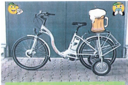
Seidle - Stammtisch E-Bike

durch das Weingartener Moor. Nach der Radtour finden wir uns in der Gärtnerklause zum Bowlen ein.