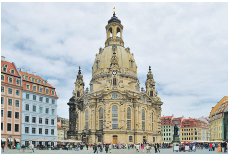
Dresden Frauenkirche