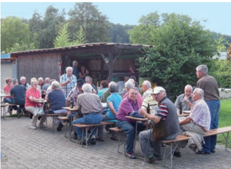
GV Frohsinn „Gäste beim Ferientreff“