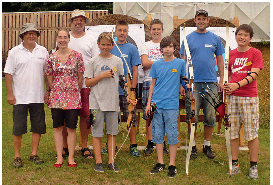
Ferienspaßteilnehmer und ihre Betreuer beim Schützenverein Weingarten

Weiter Infos über den Verein und Bilder vom Ferienspaß findet ihr auf unserer Homepage www.svweingarten.com .