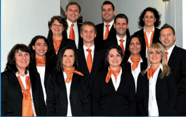
Service- und Beratungsteam Privatkunden inkl. Mitarbeiter des Finanzverbundes