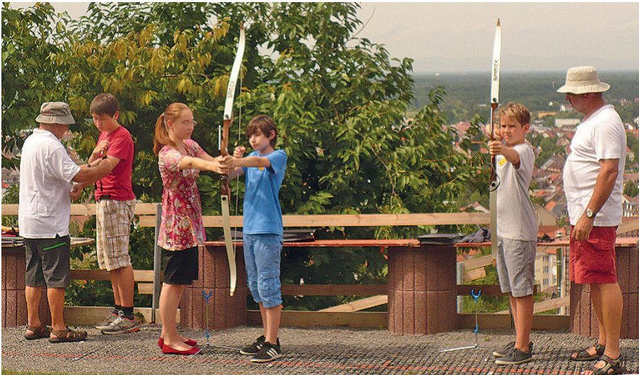
Intensive Einweisung und Betreuung der Ferienspaßler am Schießstand

Unter diesem Motto lud der Schützenverein Weingarten, beim Ferienspaßprogramm der Gemeinde Weingarten, alle interessierten Kinder ein den Schießsport einmal näher kennenzulernen.