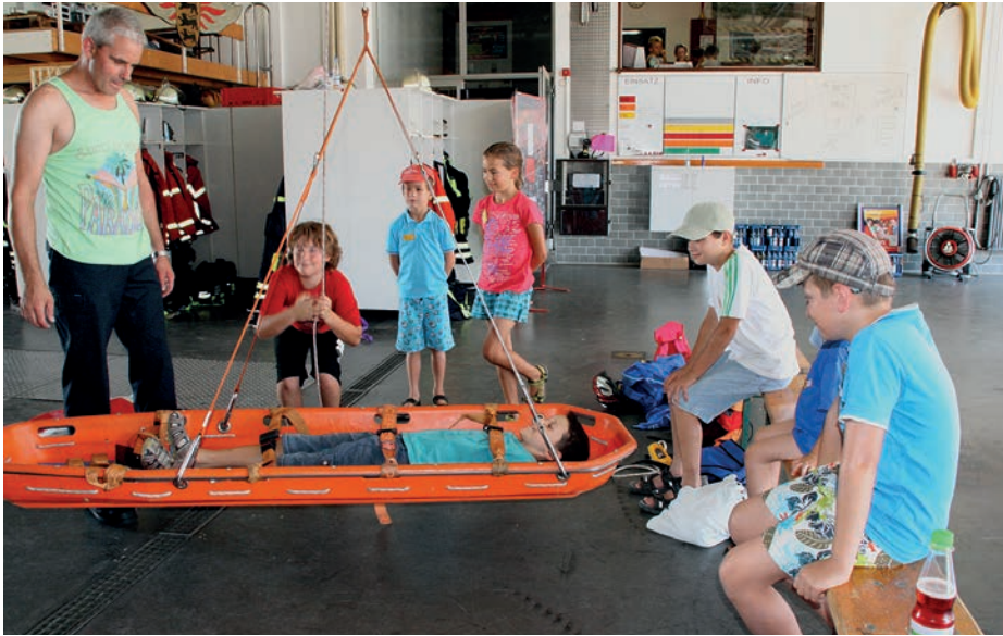
Probeliegen in der Schleifkorbtrage war eines der Highlights bei der Feuerwehr

„Nass und Spass“ nennt die Feuerwehr seit Jahren ihren beliebten Ferienspaß und seit Jahren ist die Veranstaltung regelmäßig ausgebucht. Auch in diesem Jahr hatten weit über 30 Kinder den Weg ins Feuerwehrhaus gefunden. Dabei geht es kei-