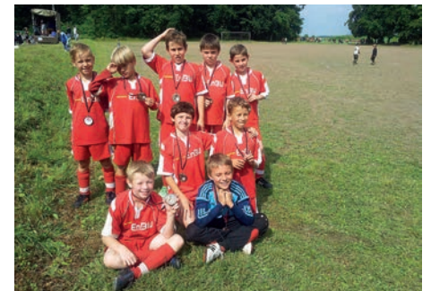
Die F1-Jugend in Blankenloch