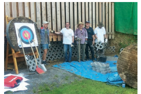
Arbeitsteam am Schiessbahnabschluss