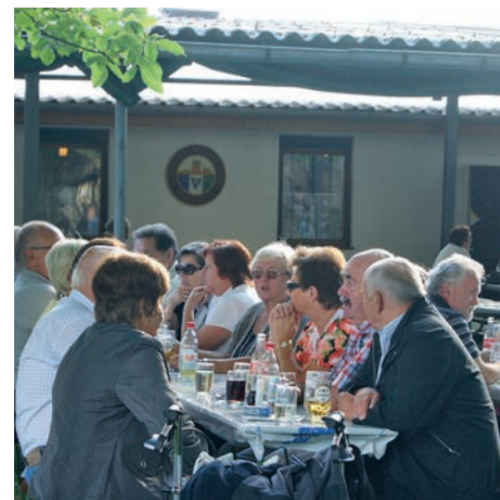
Unsere Gäste an einem schönen Festtag

Der Festbeginn ist am Samstag 16.00 Uhr und Sonntag ab 11.00 Uhr.