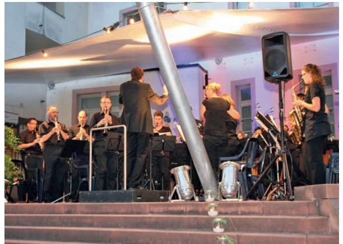
Ein musikalisches Highlight der Spitzenklasse war das Sommernachtskonzert des Musikvereins

mal Schwung und Tempo. Die übrigen Musiker kehrten auf die Bühne zurück und das Programm fuhr fort. Begonnen hatte es mit der interessanten und vielschichtigen Overtüre des „Kalif von Bagdad“, nun war der Konzertmarsch „Arsenal“ zu hören, mit dem die Weingartener immer wieder glänzen. Einige Titel aus dem Film „Grease“ mit John Travolta und Olivia Newton-John zeigten erneut das große Potenzial des Musikvereins. Dynamische Rhythmen, Swing und Rock'n'roll, plötzlich ein wehmütiges Klarinettensolo dazwischen, war symphonische Blasmusik vom Besten. Die Rakete zum Schluss hieß „Buglers Holiday“, die konzertante Umspielung militärischer Trompetensignale. Ein Ensemble von sieben Trompeten brachte den Rathausplatz zum Vibrieren und das Publikum zu stehendem Beifall. Die Stimmung zwischen Sekt und Abendsonne hätte besser nicht sein können als bei diesem Konzert der Extraklasse. Einen Teil seiner Erlöse will der Musikverein der Musikschule Bretten spenden.