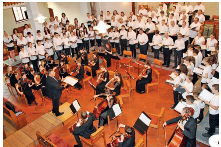
Der TMG-Chor und das Jugendkammerorchester St. Petersburg beim gemeinsamen Konzert