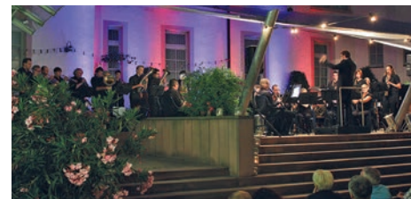
Bugler`s Holiday mit dem Trompeten-Ensemble