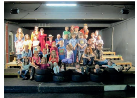
Probenbesuch der Klasse 3b