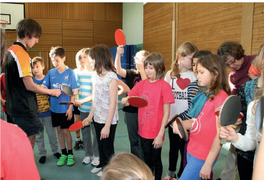
Erstmal den Schläger kennenlernen und den Ball hoch halten ist die klassische Schlüsselübung für Anfänger