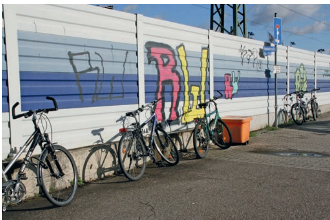
Dieses Bild soll der Vergangenheit angehören

radständer installiert. Insgesamt stehen nun zwei überdachte Abstellanlagen zur Verfügung, die von beiden Seiten zugänglich sind sowie eine nicht überdachte. Es bestehen nun also genügend Möglichkeiten, sein Rad so abzustellen, dass es keinen anderen behindert und außerdem geschützt steht. Die Gemeindeverwaltung bittet die „Bike + Ride“-Nutzer, von diesen Fahrradständern Gebrauch zu machen.