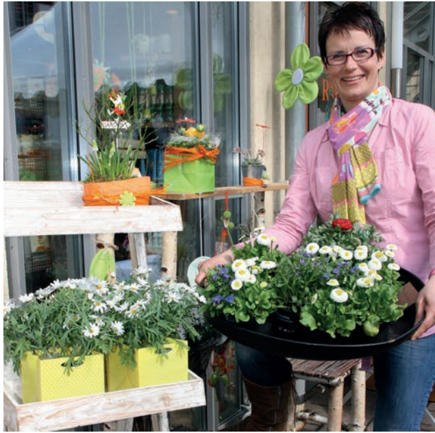
Endlich wird es bunt und der graue Winter ist vorbei