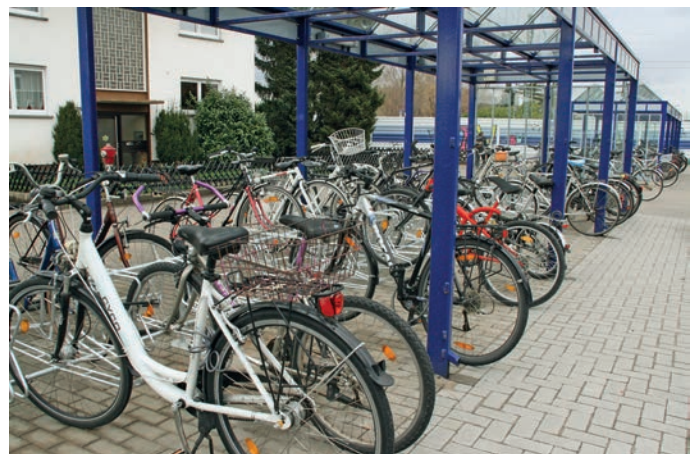
Weitere Fahrradständer installiert