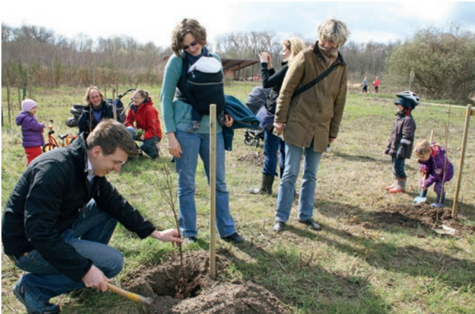
Die glücklichen Eltern beim Einpflanzen der Bäumchen