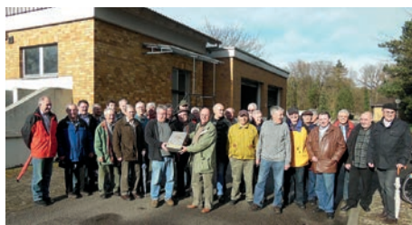
GV Frohsinn: Männerchorausflug zum Klärwerk