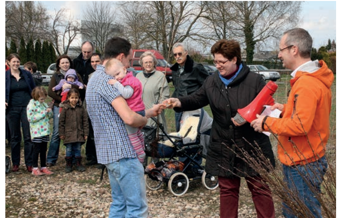
Bürgermeister Bänziger und Ordnungsamtsleiterin Gaum beim Austeilen der Bäumchen und Namensschilder

Eine beeindruckende Schar von jungen Eltern, Großeltern, Kindern und Kinderwagen hatte am Samstagnachmittag den Weg ins Gewann „Bruch“ gefunden, um einen Baum zu pflanzen.