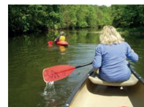
Auf der Enz

die Paddelsaison hat begonnen und wir wollen uns zusammen mit der Seglerjugend am Sonntag, 21.04.2013 zum Anpaddeln auf der Enz treffen.