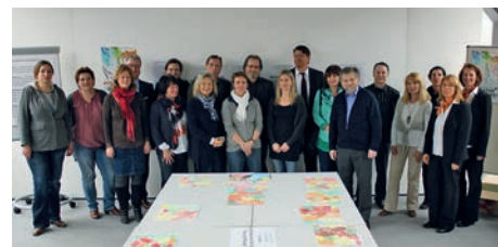
Jurymitglieder bei ihrer Arbeit

schäftsstellen der Bank wird die spannende Bekanntgabe der örtlichen Gewinner mit anschließender Ausstellung der Siegerbilder stattfinden.