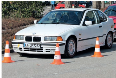
Mit neuem Fahrwerk geht's flotter um die Ecken