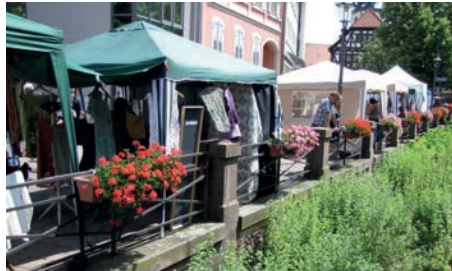
Stände am Bach entlang

Klein-Montmartre in Weingarten. Aufruf an alle kreativen Frauen: Am Samstag den 29. Juni 2013 findet von 9-15 Uhr auf dem Rathausplatz in Weingarten der 9. Frauenkreativitätsmarkt Klein-Montmartre statt. Jede kreativ tätige Frau soll die Möglichkeit haben, sich und ihre Kreativität dort vorzustellen, egal ob sie Berufssoder Freizeitkünstlerin ist. Wenn Sie mit Farben, Stoffen, Naturmate-