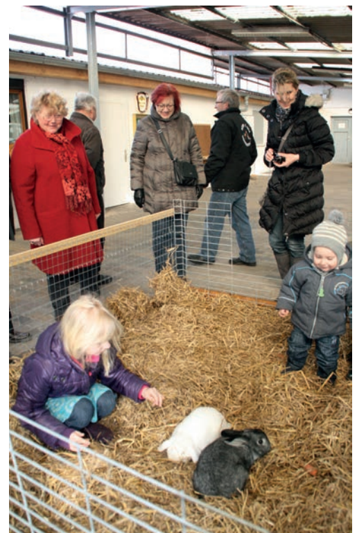
Kaninchen werden von Kindern immer gern besucht und gestreichelt