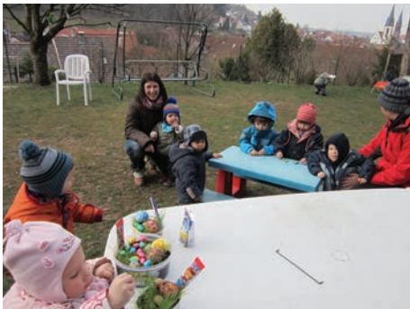
Ostern im Blauland

An diesem Tag schlief nicht nur der Osterhase schnell ein!