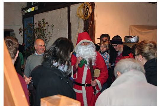
Der Nikolaus beschenkte die Kinder

eder. Um allen die Möglichkeit zu geben, mitsingen zu können, wurden Liedertexte verteilt. Und so stellte sich bei groß und klein weihnachtliche Stimmung ein. Und weil es gerade so schön weihnachtlich war, kam ein großer Mann daher, und beschenkte die Kinder. Es war der Nikolaus höchstpersönlich. Natürlich wurde die Kehle ganz trocken vom vielen Singen und der Hunger stellte sich auch ein. Da schmeckte der selbst gekochte Glühwein und Kinderpunsch gleich nochmal so gut. Nachdem das letzte Weihnachtslied „Stille Nacht“ verklungen war, luden die gemütlichen Räume des fränkischen Hofes noch zum Bleiben ein. Ein herzliches Dan-