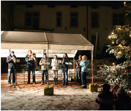
In wechselnden Gruppen musizieren die Jugendlichen des Musikvereins auf dem Rathausplatz, die Jugendfeuerwehr brät Bratwurst

Die Äste des Weihnachtsbaums auf dem Weingartener Rathausplatz sind weihnachtlich dekorativ verschneit.