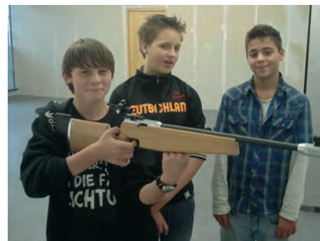
Trainingsstunde mit dem Lasergewehr