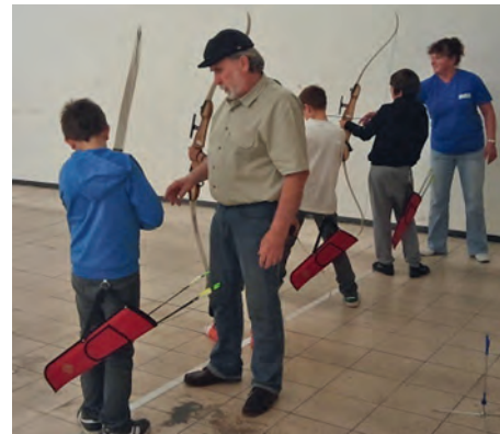
Trainingsstunde mit dem Sportbogen